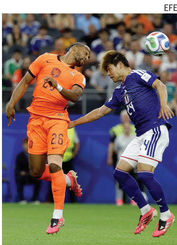
EMOTIVO. El encuentro tuvo ocasiones y goles.

La próxima fecha del grupo traerá nuevos desafíos para ambas selecciones. Japón se medirá con Túnez el 21 de junio a la 1.00 (hora de Argentina), mientras que ese mismo día, desde las 14.00, Países Bajos chocará con Suecia.