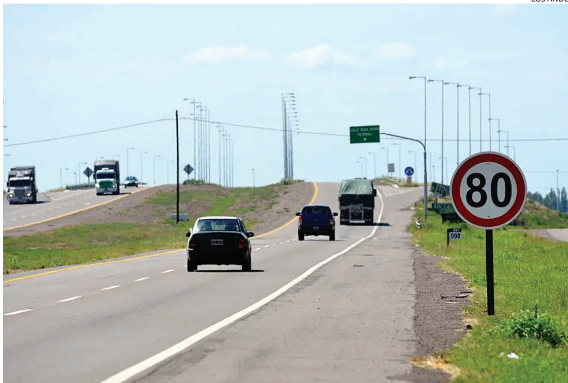
ÁREA CONTROLADA. Los controles de velocidad en las rutas 7 y 50 volverán a estar vigentes en Santa Rosa.

las ordenanzas que frenaron el sistema, Santa Rosa busca dejar atrás ese capítulo y volver a poner en marcha los controles.