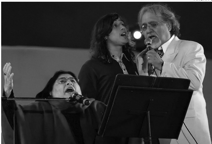
CON MERCEDES. Con la Negra Sosa ganó proyección nacional.

ADIÓS AL POCHO. El cantautor mendocino desplegó una trayectoria de más de cincuenta años dedicada a la tonada, la cueca y el folclore cuyano. Fue despedido en la Legislatura y el Gobierno decretó dos días de duelo provincial.