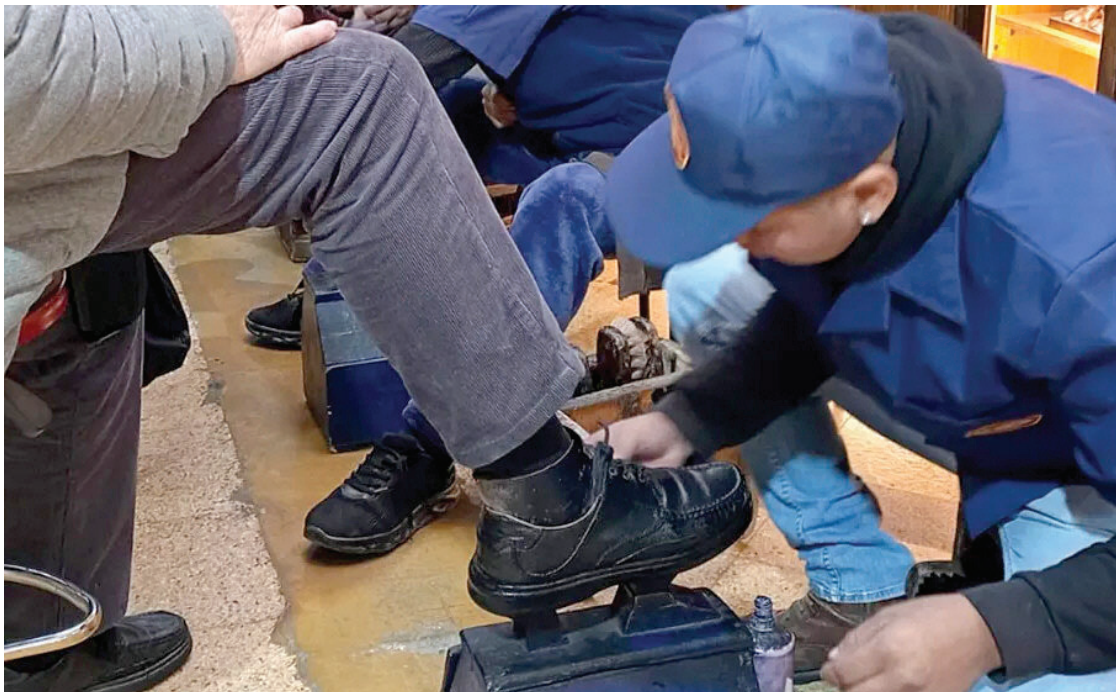
BRILLANTES. Los Rodríguez dieron cátedra de cómo se lustran los zapatos.

Uno de los primeros en la familia en comenzar el oficio fue Mi-