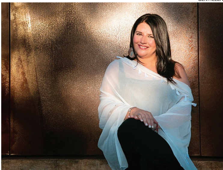
TRISTEZA Y CARIÑO. El Pocho deja un buen recuerdo entre su gente.