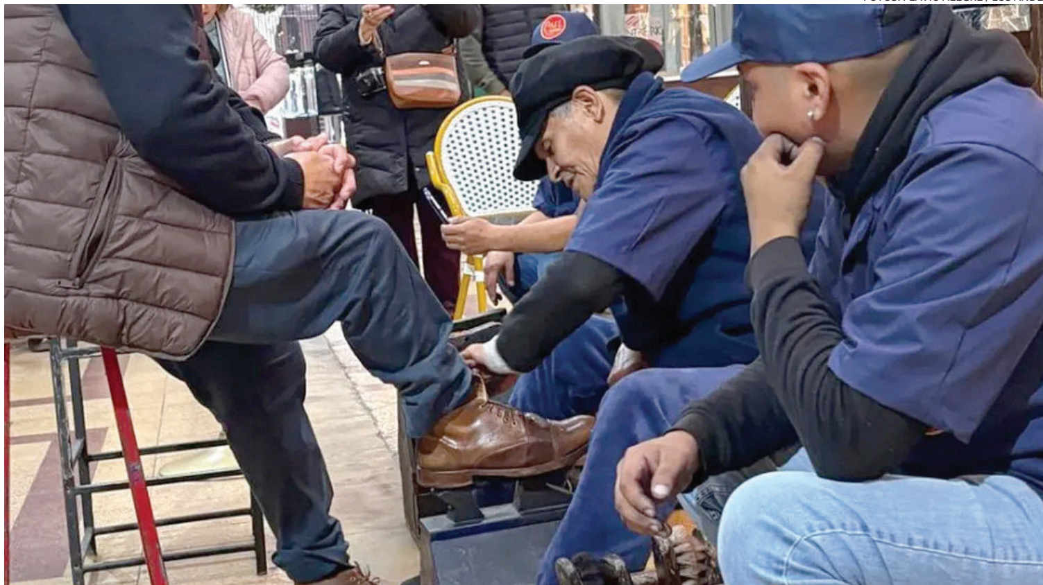
PERSONAJES DE LA CIUDAD. Los históricos lustrabotas son parte de la identidad mendocina.