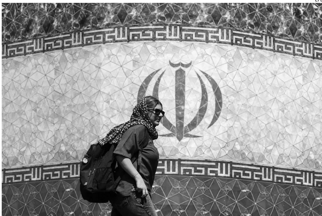
EN PAZ. Una mujer iraní pasa junto a una valla publicitaria con la bandera de Irán en la plaza Enqelab, en Teherán.