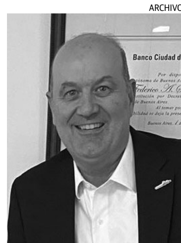
STURZENEGGER. Su ministerio impulsa los cambios.

La actual legislación prohíbe que extranjeros tengan más de 15% de un territorio en nuestro país.