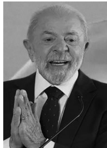
EN VIAJE. Lula se embarcó rumbo a Francia para participar del G7.

Casa Blanca, en Brasilia la nueva oleada de agresiones se interpreta en clave electoral: Lula cargó la culpa sobre las maniobras de la oposición de derecha liderada por el senador Flávio Bolsonaro, su principal rival para las elecciones presidenciales del 4 de octubre.