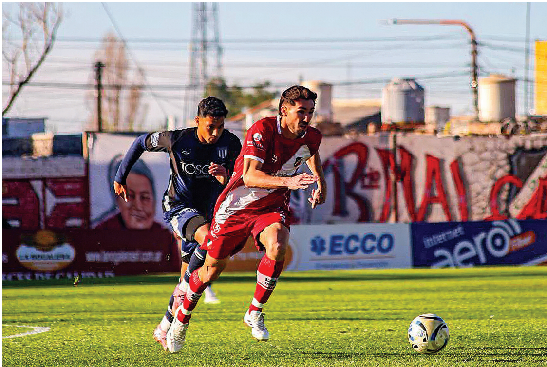
IRREGULAR. Deportivo Maipú tuvo una floja tarde ante Tristán Suárez y casi no generó situaciones de riesgo.

El presidente de la Federación Real Marroquí de Fútbol (FRMF), Fouzi Lekjaa, aseguró que le gustaría un cruce con España en la final del Mundial 2026 para "demostrar" a Lamine Yamal si eligió bien su selección. "Espero que nos encontremos con él en una final para aclararle si eligió bien", dijo, aunque aclaró su respeto por la decisión del jugador. Lekjaa recordó que Marruecos intentó convencerlo sin éxito y destacó el proyecto del fútbol marroquí y la captación de talentos europeos. "Somos un país que ofrece la oportunidad de participar en Mundiales", dijo.