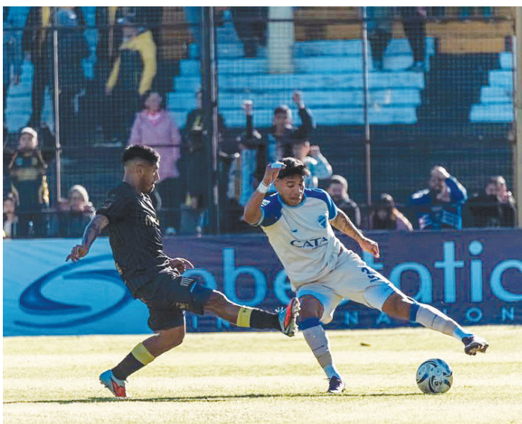
GOLPEADO. Godoy Cruz volvió a perder fuera de casa.