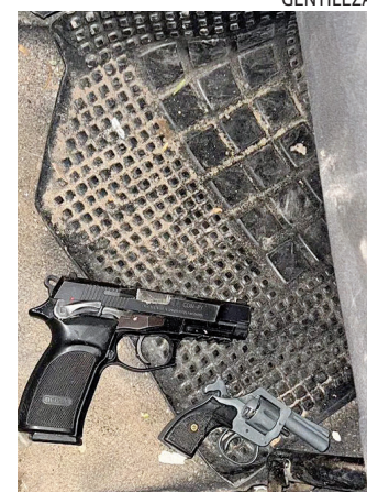
SECUESTRO. Las tres armas.

La medida marca el cierre de una disputa política que atravesó casi dos años, aunque difícilmente ponga fin al debate de fondo.