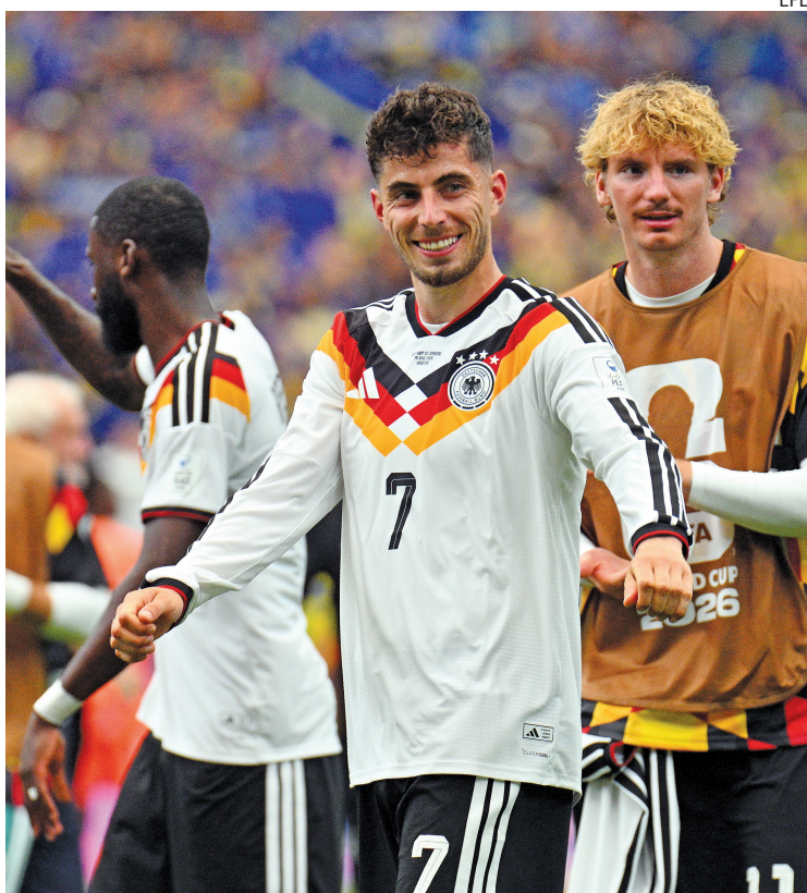
POTENCIA. Havertz anotó un doblete para la goleada teutona.

En el segundo tiempo, Alemania no bajó el ritmo. Kimmich filtró un pase preciso que permitió a Musiala definir de primera para el 4-1.