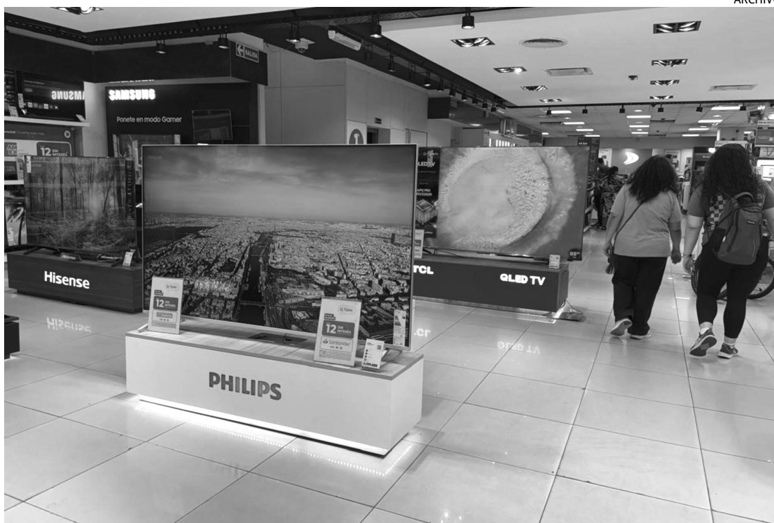
GIGANTE. Las distintas cadenas reflejaron el fenómeno: ver los partidos casi como en el cine.

"Por un lado, las marcas adelantan esfuerzos comerciales para capitalizar la previa del torneo, cuando la intención de compra aumenta. Esto cambia la dinámica habitual: mientras que en un año normal cerca de 60% de las ventas se concentra en el segundo semestre, en años de Mundial esa relación se empareja o revierte", explicaron.