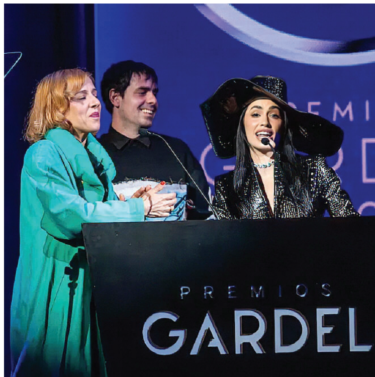
LALI. Celebró su premio a mejor canción pop junto a Juliana Gattas.

PREMIOS GARDEL. Fue por el disco “La vida era más corta”, que fusiona folclore con sonidos urbanos. A los 19 años consiguió 12 estatuillas del máximo galardón de la escena musical.