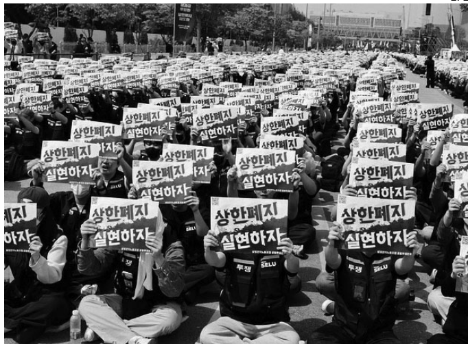
BONO IA. El beneficio alcanzará inicialmente a 78.000 trabajadores.