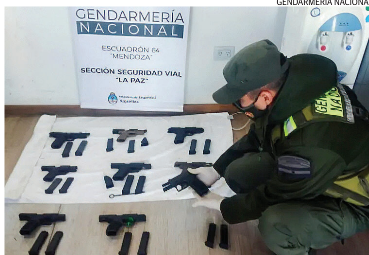
SECUESTRO. El condenado tenía 23 armas de guerra de distinto tipo.

Las armas fueron encontradas por personal de Seguridad Vial La Paz de Gendarmería Nacional el 28 de mayo de 2024, en la ruta nacional 7, a la altura del peaje de La Paz. Allí los uniformados interceptaron un ómnibus que provenía de la terminal de Retiro, en Buenos Aires, y que tenía como destino final la Ciudad de Mendoza.