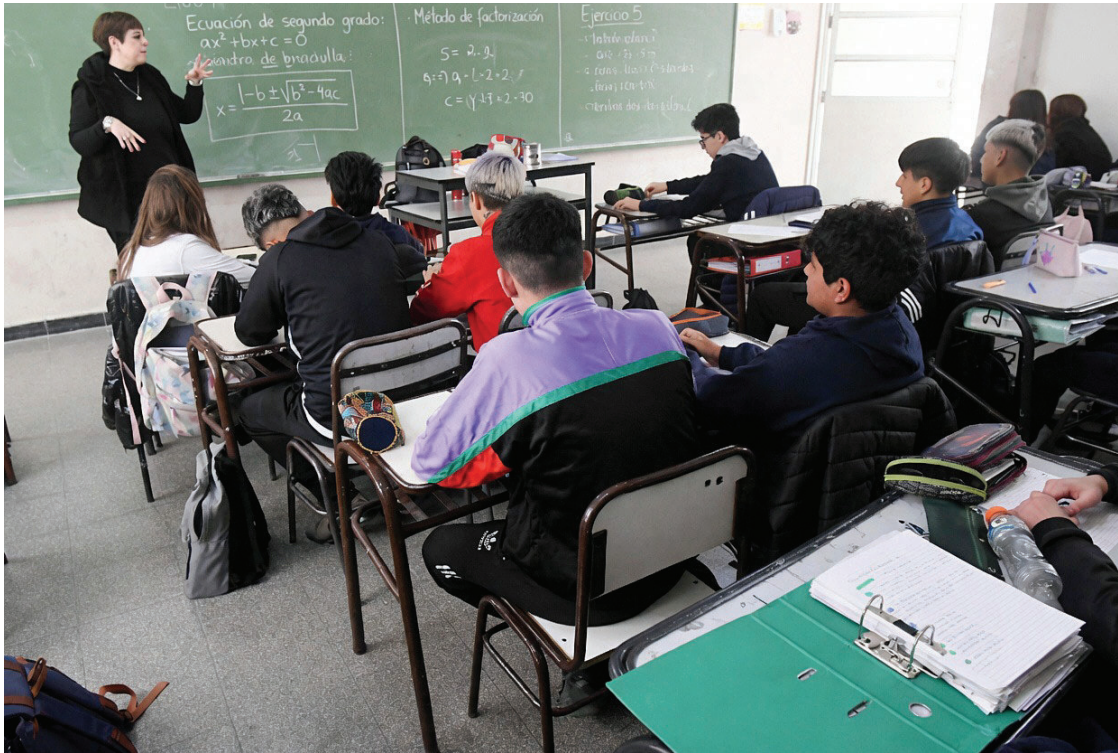
APATÍA. Para 82,3% de los docentes, el mayor problema de la secundaria es la falta de motivación de los chicos.

Según el informe, los educadores realizan una evaluación más crítica del sistema educativo en