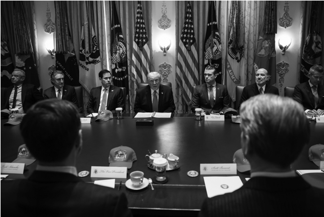
PLANA MAYOR. Donald Trump habla en la reunión de gabinete de ayer en la Casa Blanca.