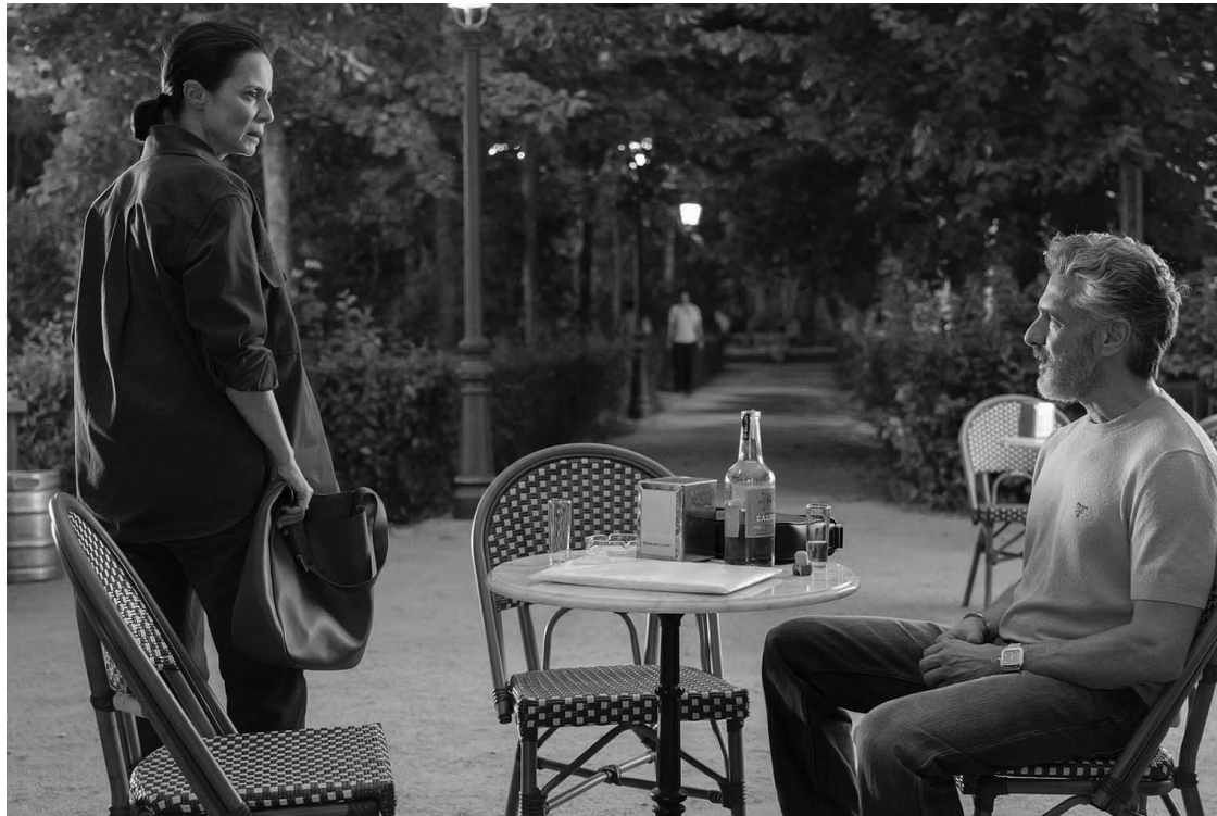
AMARGA NAVIDAD. Aitana Sánchez-Gijón y Leonardo Sbaraglia, en una escena de la película.

La historia gira alrededor de la crisis creativa, el dolor y los límites de la autoficción. Raúl,