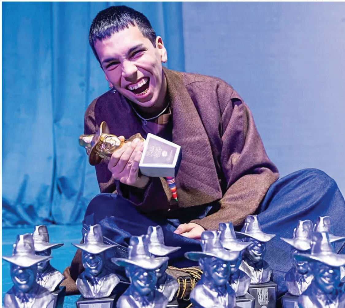
MILO J. El joven que mezcla el folclore con la música urbana se llevó 13 premios.