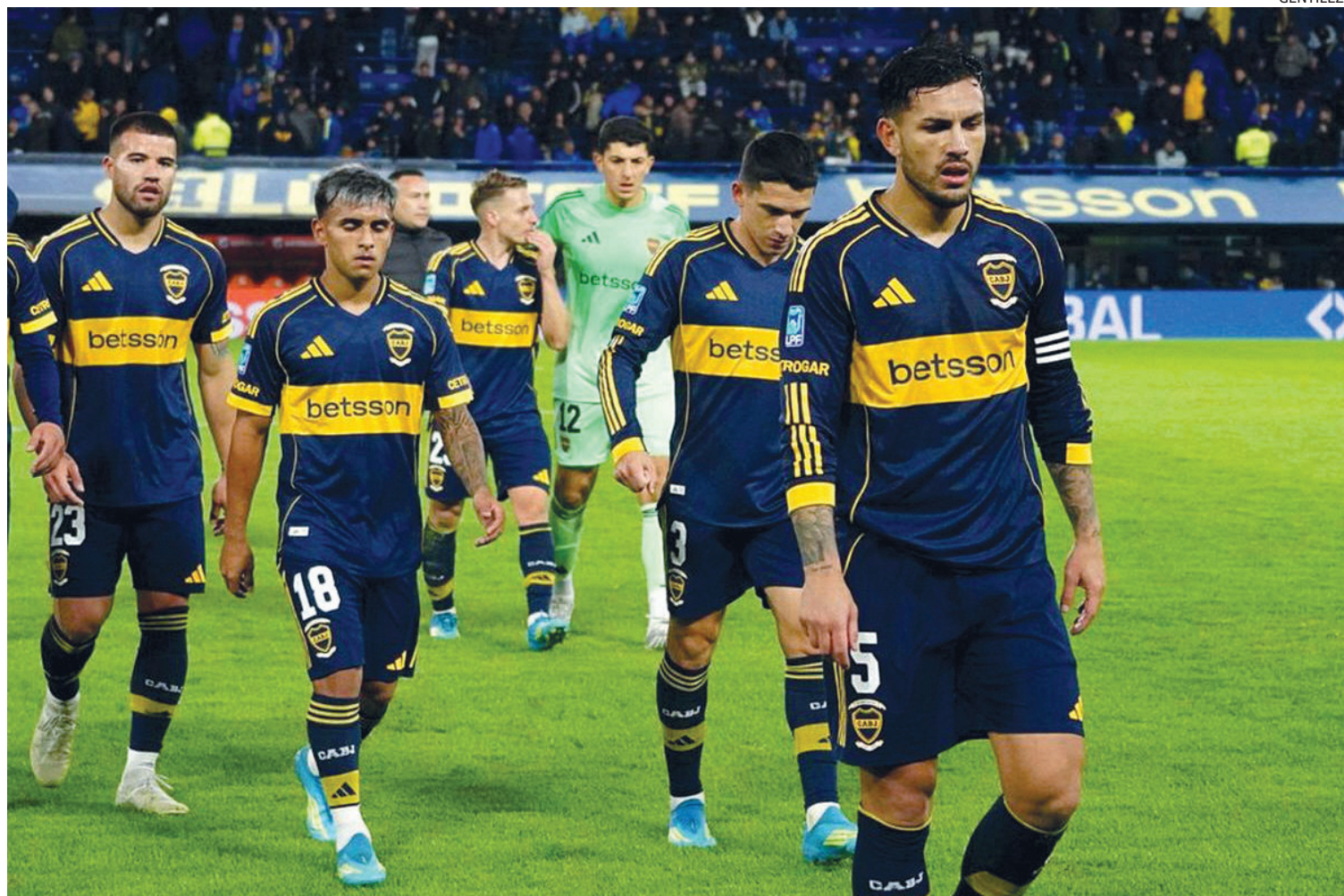
COMPLICADO. Increíblemente, Boca Juniors llegó a la última fecha de la fase de grupos sin margen de error: debe ganar o adiós Libertadores.