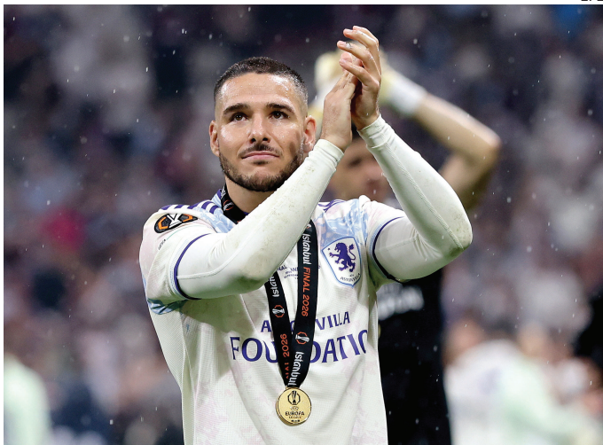
CLASE. El marplatense fue elegido figura y MVP de la Europa League.

El golazo del talentoso delantero argentino Emiliano Buendía en la final ante Friburgo fue elegido por los hinchas como el mejor de la Europa League 2025/26. El marplatense, figura y MVP de la definición, sacó un zurdazo preciso al ángulo para marcar uno de los tantos del Aston Villa campeón. La votación fue organizada por UEFA entre diez candidatos seleccionados por su Grupo de Observadores Técnicos.