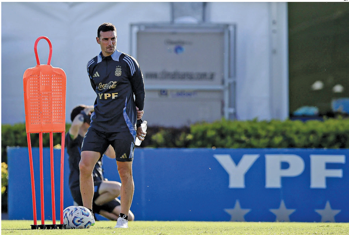
INMINENTE. El DT argentino, Lionel Scaloni, ultima detalles para el anuncio de los 26 convocados al Mundial.

Respecto de los juveniles convocados, dijo: “Más allá que sean jóvenes y pensando en el futuro, todo lo que hacemos es pensando en que puedan apor-