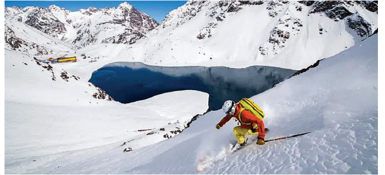
CHILENO. Otra de las opciones, del otro lado de la cordillera, es Portillo.

TEMPORADA 2026. Los Puquios (en Mendoza) y Portillo (Chile) ya confirmaron tarifas para estas vacaciones, mientras que Las Leñas (el más importante de nuestra provincia) sigue sin definiciones.