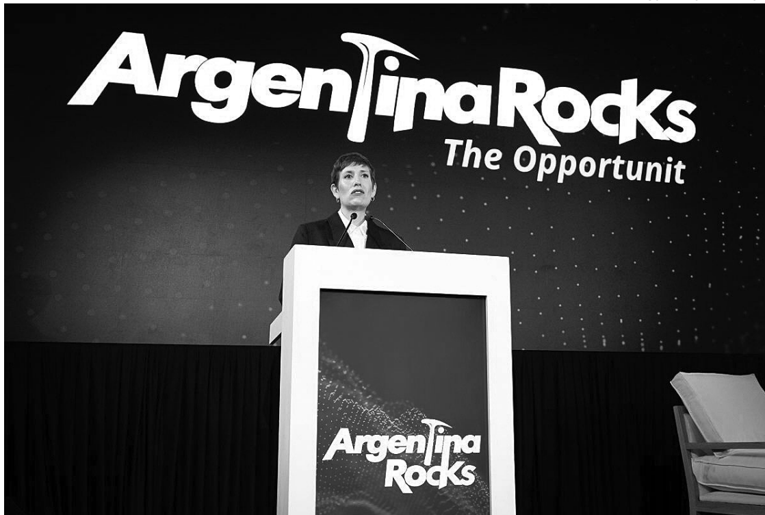
CAPITAL. Mendoza es sede de Argentina Rocks, evento diseñado para especialistas en exploración y geología.

"Conocemos el potencial geológico que tiene Mendoza y la región andina, algo en lo que coincidimos con muchos de quienes hoy nos visitan desde Chile, Perú y Bolivia. Pero hay una diferencia entre tener esos recursos, poder extraerlos y darles un valor económico que aporte, efectivamente, a la reconversión de nuestra matriz energética, a la electrificación de nuestras ciudades, a mejores tecnologías y al bienestar de la población. Para eso se necesita un mayor conocimiento", resaltó la ministra. "La presencia de profesionales,