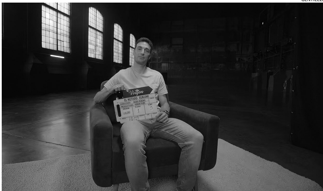
LA GESTA DE QATAR. La serie documental repasa los pormenores del glorioso Mundial 2022.

El documental contará con entrevistas inéditas a Lionel