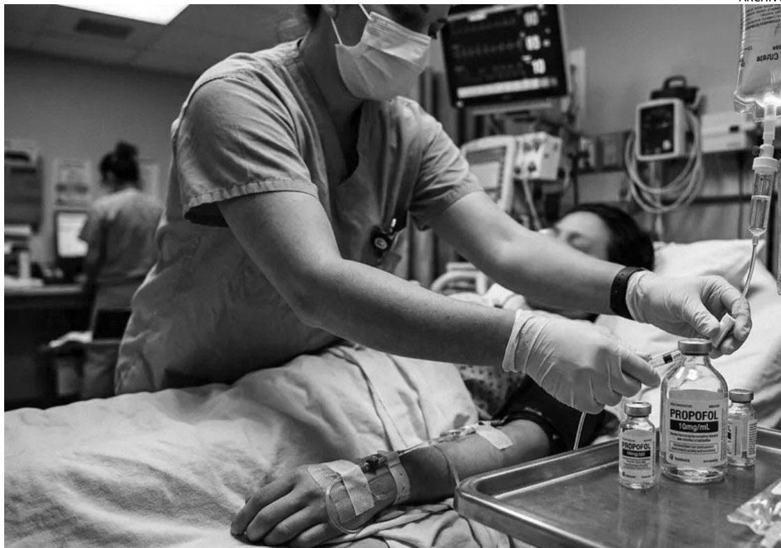
IMPACTO. La precarización de las prestaciones de obras sociales y el aumento de costos complican.

En segundo lugar quedaron los giros por Universalización de la Jornada Extendida (por $35.000 millones) explicando 23% de total pagado y después vienen los aportes para Comedores Escolares por $27.000 millones (17% del total).