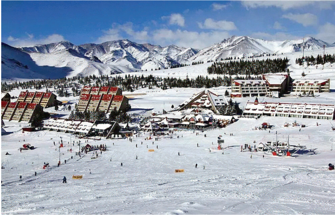
NEIEVE. Las definiciones, sobre todo para Las Leñas, dependen de los pronósticos sobre caída de nieve.