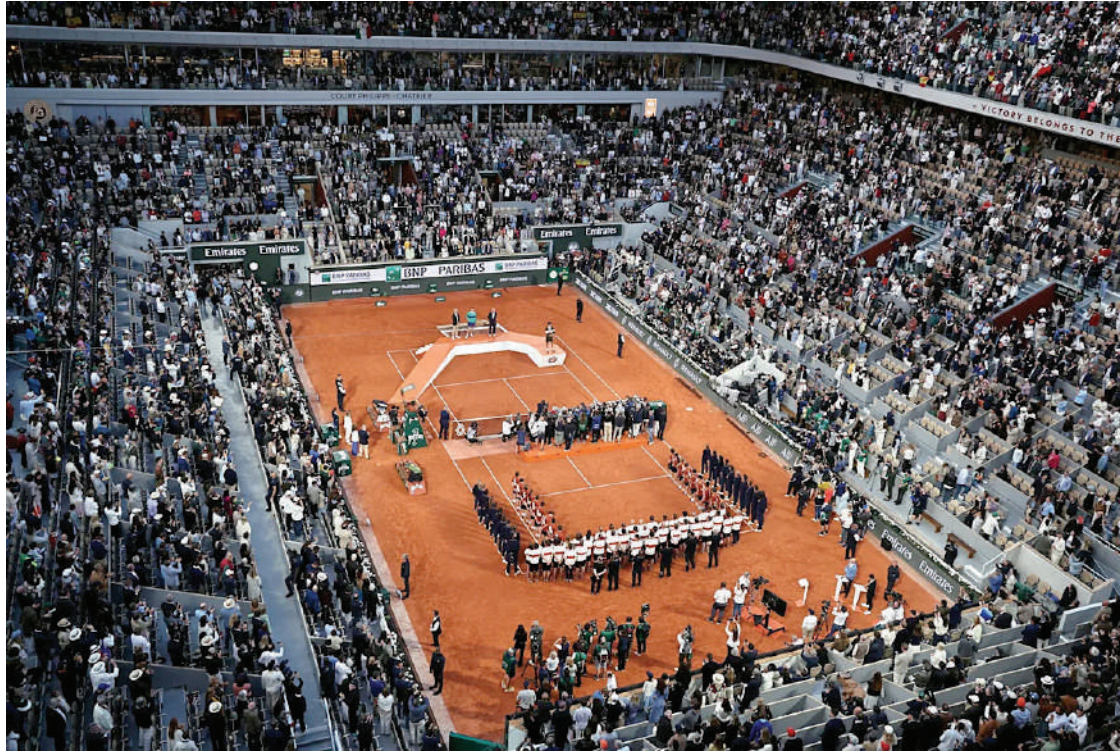
OTRA ERA. Roland Garros marcaría el inicio de la gran revolución del tenis, con Sinner y Sabalenka al frente.

Y destacó: "Más allá del dinero de premios, un torneo de Grand Slam como Roland Garros ofrece a los jugadores una exposición excepcional, generando ingresos indirectos a través de patrocinios, alianzas, exhibiciones y pagos por participación. Este año la Federación Francesa de Tenis también optó por destinar una parte significativa de estos aumentos a los jugadores elimi-