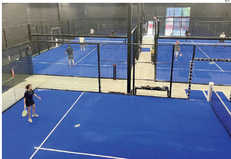
EXPLOSIÓN. El crecimiento del pádel marcará un hito en Santa Fe 2026.