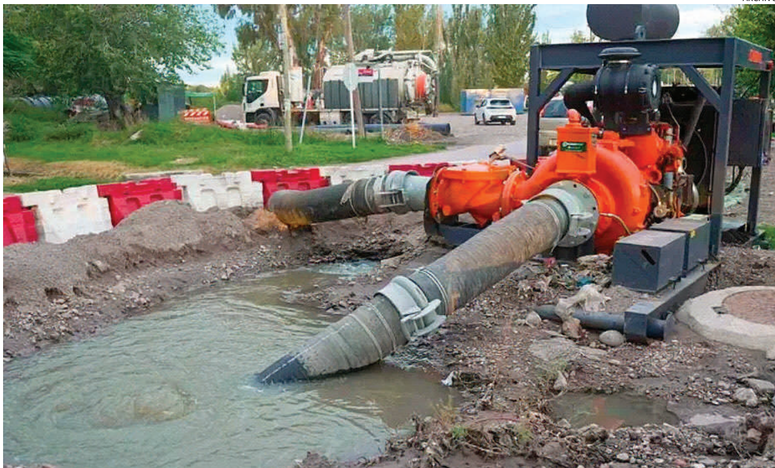
SANCIÓN. La resolución indica que Aysam volcó efluentes cloacales sin tratamiento y dañó infraestructura en la zona de Severo del Castillo y 2 de Mayo.

La resolución también emplaza a Aysam a presentar un plan