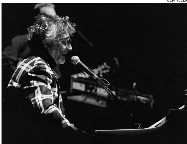
FITO PÁEZ. El músico, en un momento del show en el Movistar Arena.

Algunos incluso se volcaron a sus redes sociales para manifestar su descontento en tiempo real, mientras Páez tocaba en el escenario del microesta-