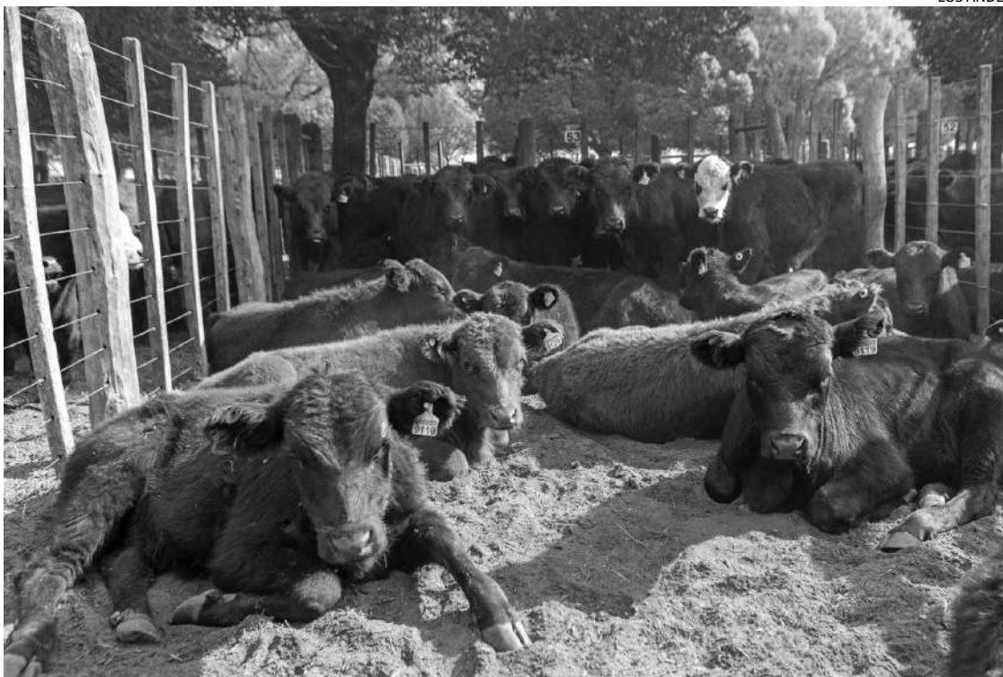
PRECIOS. Una vaca cuesta cerca de $2,5 millones y un toro puede llegar hasta los $10 millones.

Al referirse al destino de la comercialización del producto robado, el funcionario explicó que “alguien que compra a un carnicero media res por la vía legal mete otro tanto por la parte ilegal. Por eso lo llevan en freezers y después lo sacan. Por ejemplo, ahora tenemos un laboratorio para identificar cuando es carne de caballo, que es más barata. Entonces muelen carne bovina junto con carne equina”.