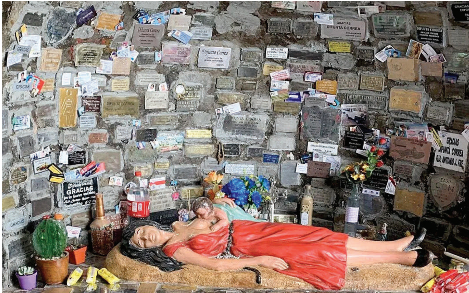
ICÓNICA. La popular imagen de la Difunta Correa y su hijo que veneran miles de peregrinos en su santuario de San Juan.