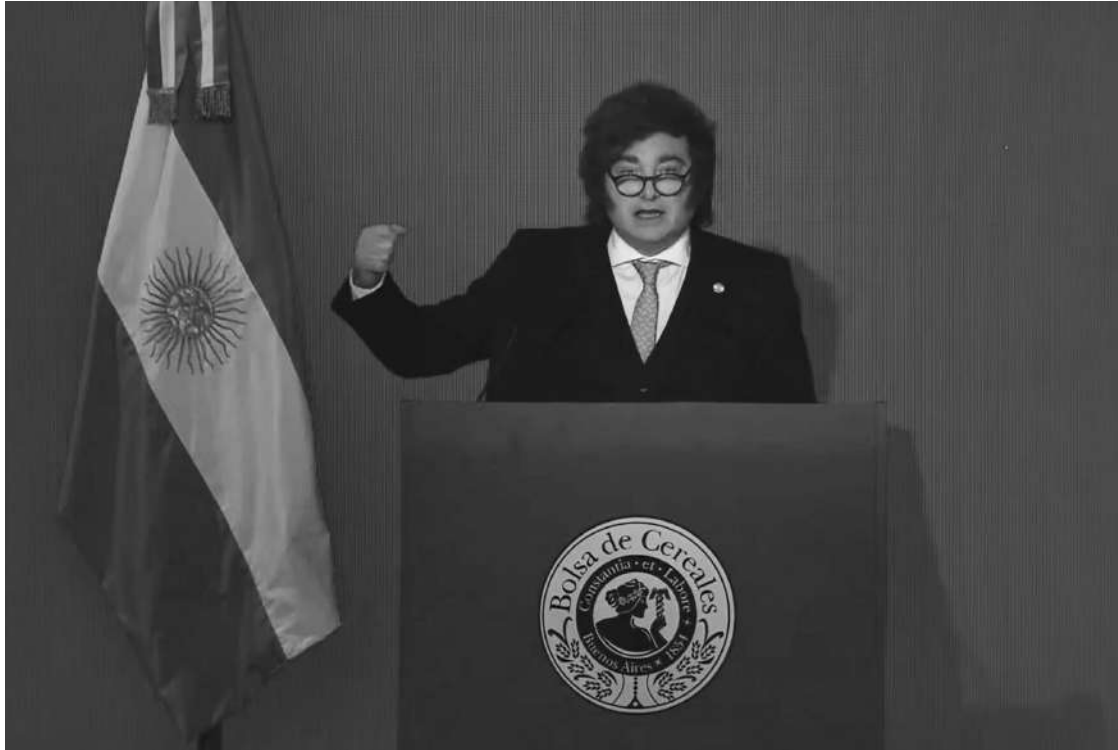
LA NOVEDAD. El presidente Milei anunció baja de retenciones en la Bolsa de Cereales de Buenos Aires.

Cobos afirmó que, a pesar de todo, habrá ofertas privadas para arreglar la Ruta 7, pero que esto se deberá a la parálisis de la obra pública nacional.