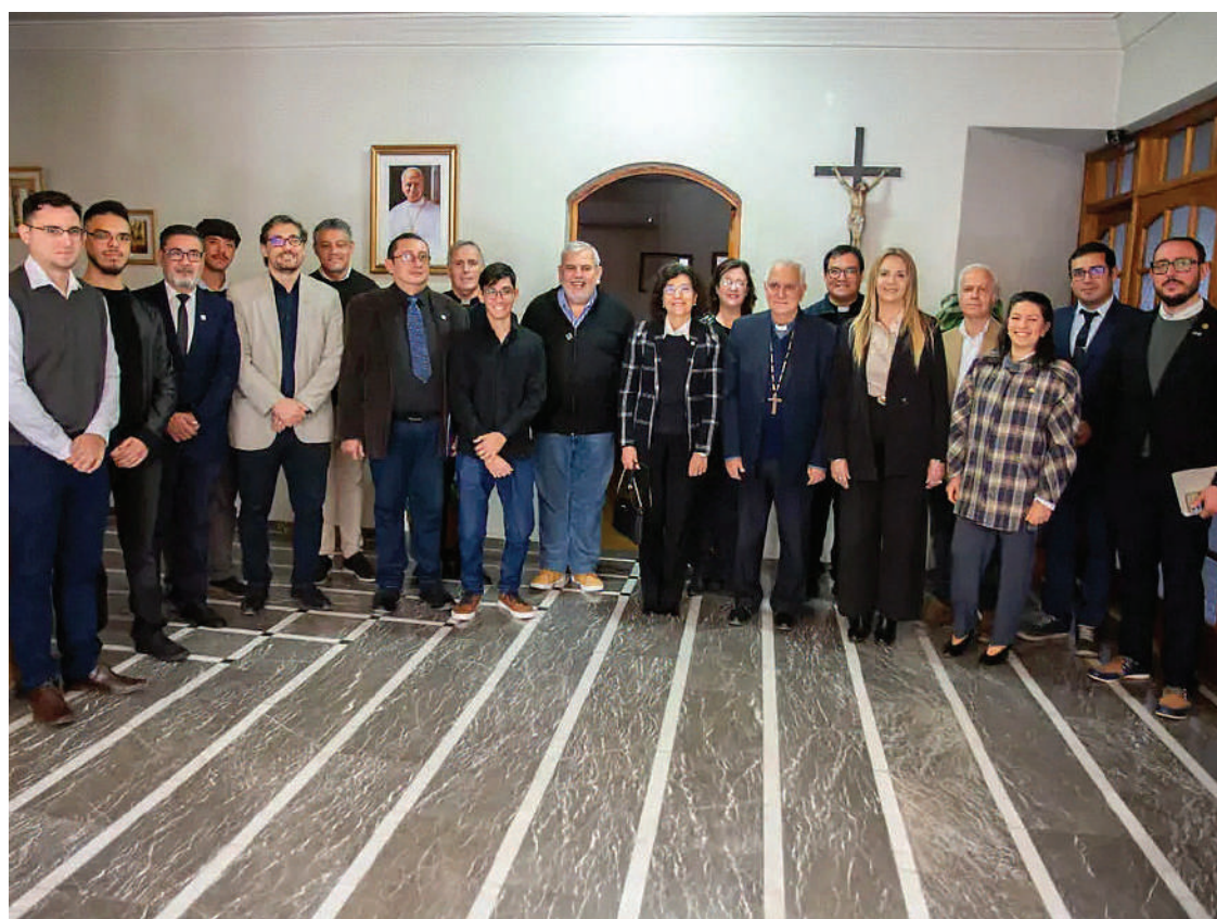
REUNIDOS. El equipo que investiga en actas, libros y noticias la existencia de la mujer en quien se funda la creencia.