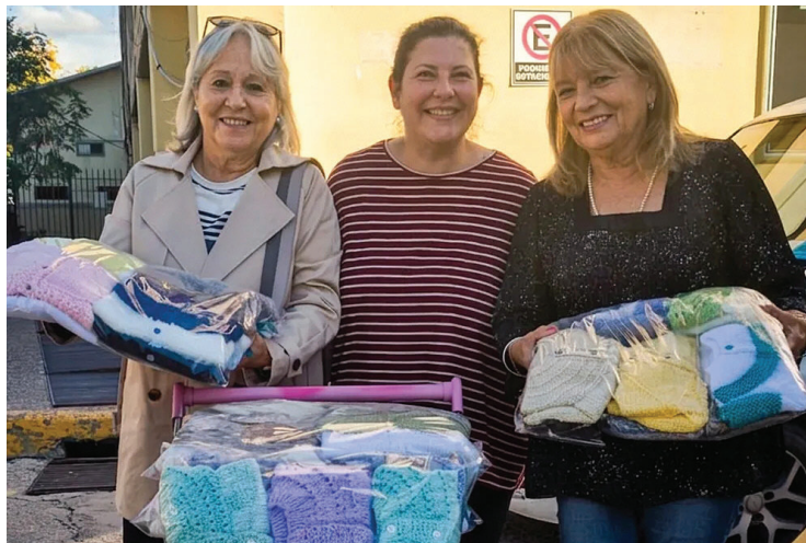
TODO LISTO. Las voluntarias, con su trabajo recién terminado.

Antes también colaboraban con el Hospital Carrillo, pero dejaron de hacerlo cuando la institución dejó de contar con mater-