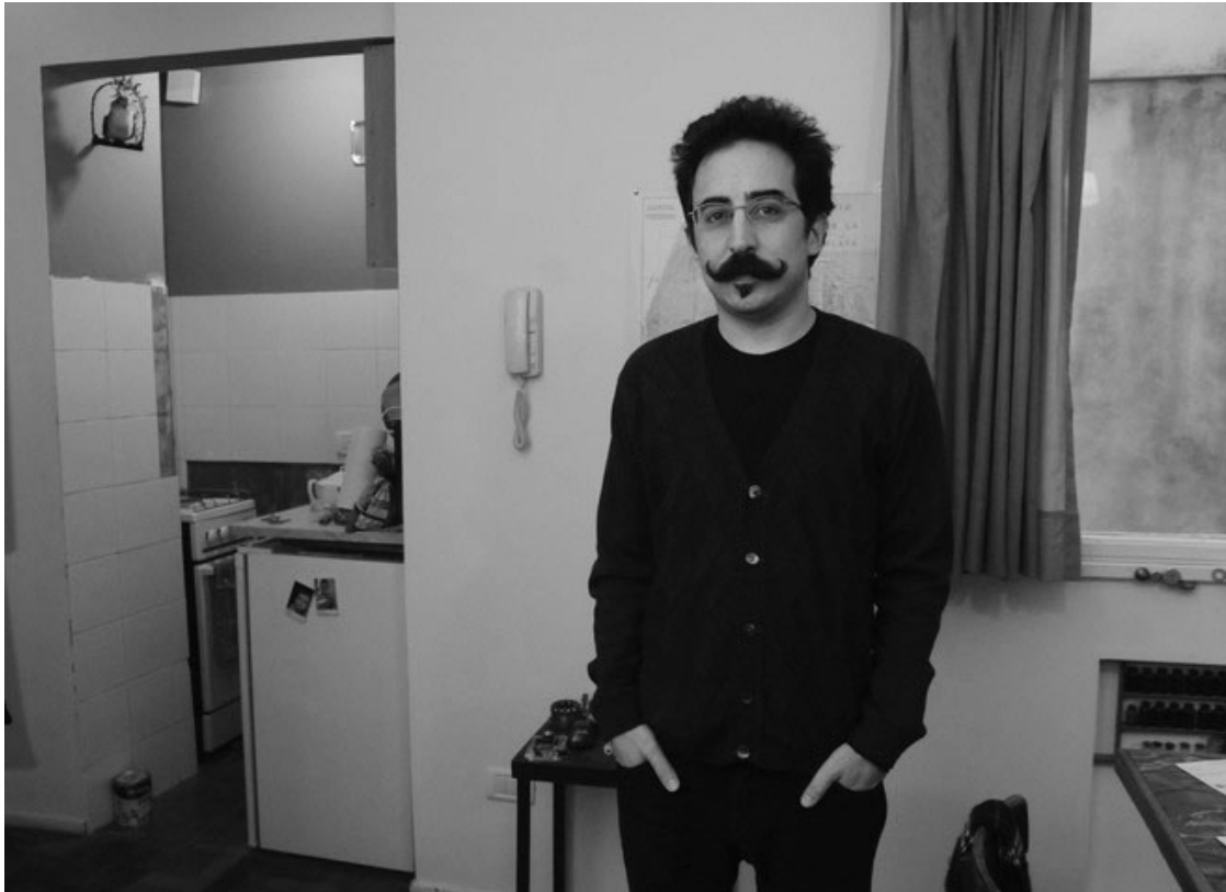
EXPERIMENTAL. Una de los adjetivos que mejor le caben a la literatura de Pablo Katchadjian.