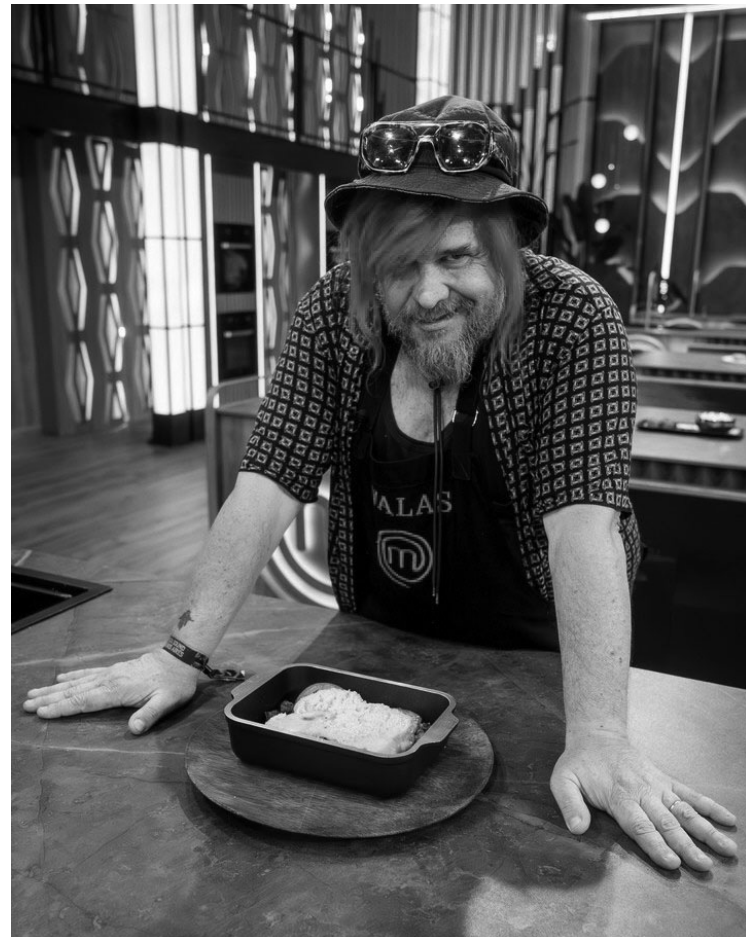
WALLAS. De estrella de rock “outsider” a celebridad de la TV.

Finalmente, al ser consultado sobre si esta nueva etiqueta de “ celebrity ” condiciona sus