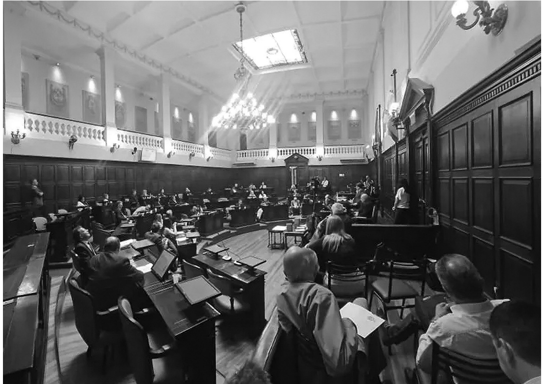
RESPALDO. La ley tuvo 28 votos a favor, entre ellos de los senadores kirchneristas, que se diferenciaron del PJ

El Quemado ocupa 600 hectáreas con 500 mil paneles bifaciales que lo dotan de una capacidad instalada de 305 MW.