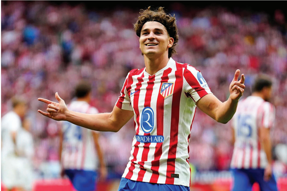
OBSESIÓN. Luis Enrique ya confirmó su deseo de sumar a Julián Álvarez. Tras el Mundial, podría haber traspaso.

La oferta del PSG es similar a la que preparaba el Barcelona aunque, siempre al borde del fair play financiero, los catala-