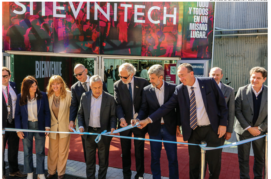
CORTE DE CINTAS. La apertura de la feria contó con la presencia de autoridades y referentes del sector.

Antes del corte de cintas, el gobernador Alfredo Cornejo expre-