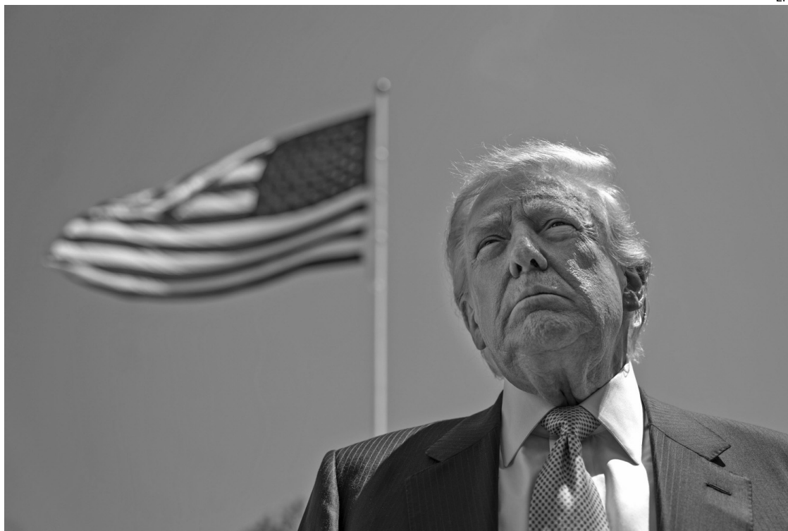
REUNIÓN. Trump abrirá hoy la visita oficial a China, en la cumbre se tratarán temas comerciales y geopolíticos.