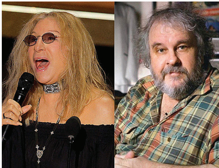
PREMIADOS. Barbra Streisand y Peter Jackson, galardonados.

La responsabilidad de elegir al sucesor de la Palma de Oro recae este año en un jurado presidido por el prestigioso realizador surcoreano Park Chan-Wook. Su nombramiento garantiza una mirada analítica, visceral y profundamente estética sobre las 22 películas en competencia.