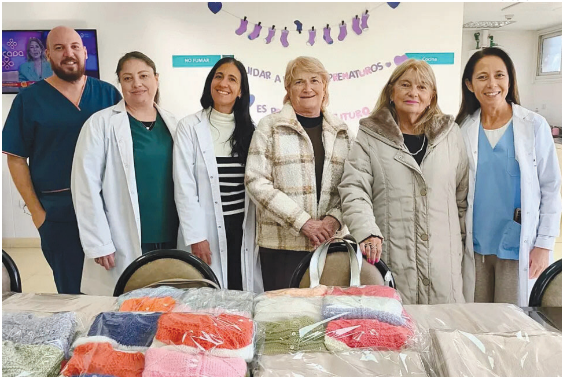
SOLIDARIAS. Las tejedoras voluntarias que crean abrigos para los recién nacidos del Hospital Perrupato.

Las tejedoras compran la lana con dinero propio. Aunque en