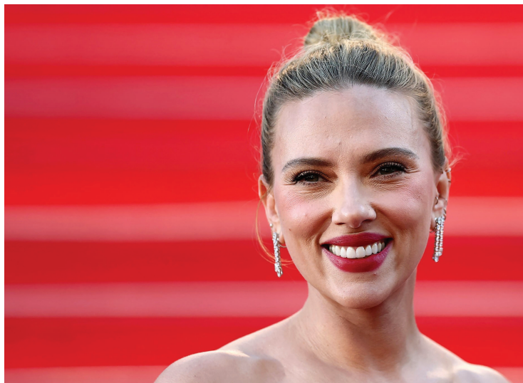
BELLEZA Y TALENTO. Scarlett Johansson brilló en la alfombra roja.

Junto a él, un equipo de cineastas y actores de diversos continentes deberá debatir sobre obras que este año parecen estar marcadas por una temática recurrente: la memoria y la identidad en tiempos de crisis.