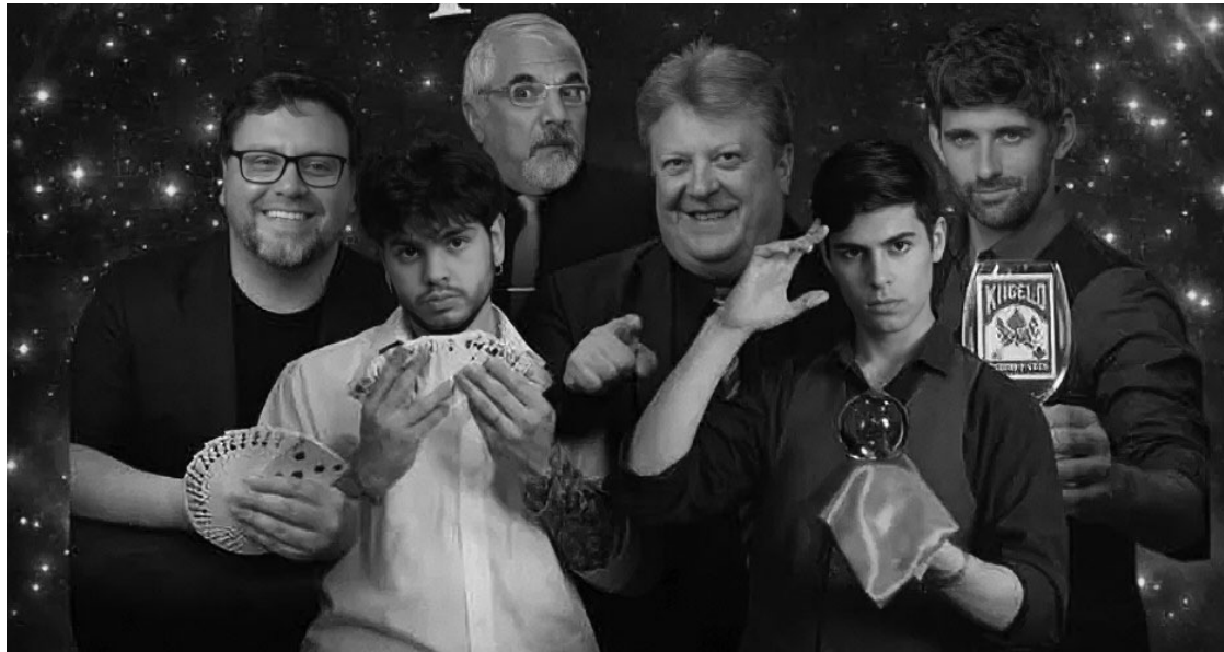
JUNTOS. Magos reconocidos de Argentina y países vecinos ofrecerán sus espectáculos en Mendoza.

La propuesta marcará el inicio formal del 5º Congreso Internacional de Magia Mendoza Mágica, un evento que con el paso de los años logró consolidarse como uno de los encuentros más relevantes del género en Sudamérica. Más que un festival de espectáculos, el congreso funciona como un espacio de intercambio entre artistas, conferencistas y amantes del ilusionismo, posicionando a Mendoza como uno de los polos latinoamericanos de esta disciplina.