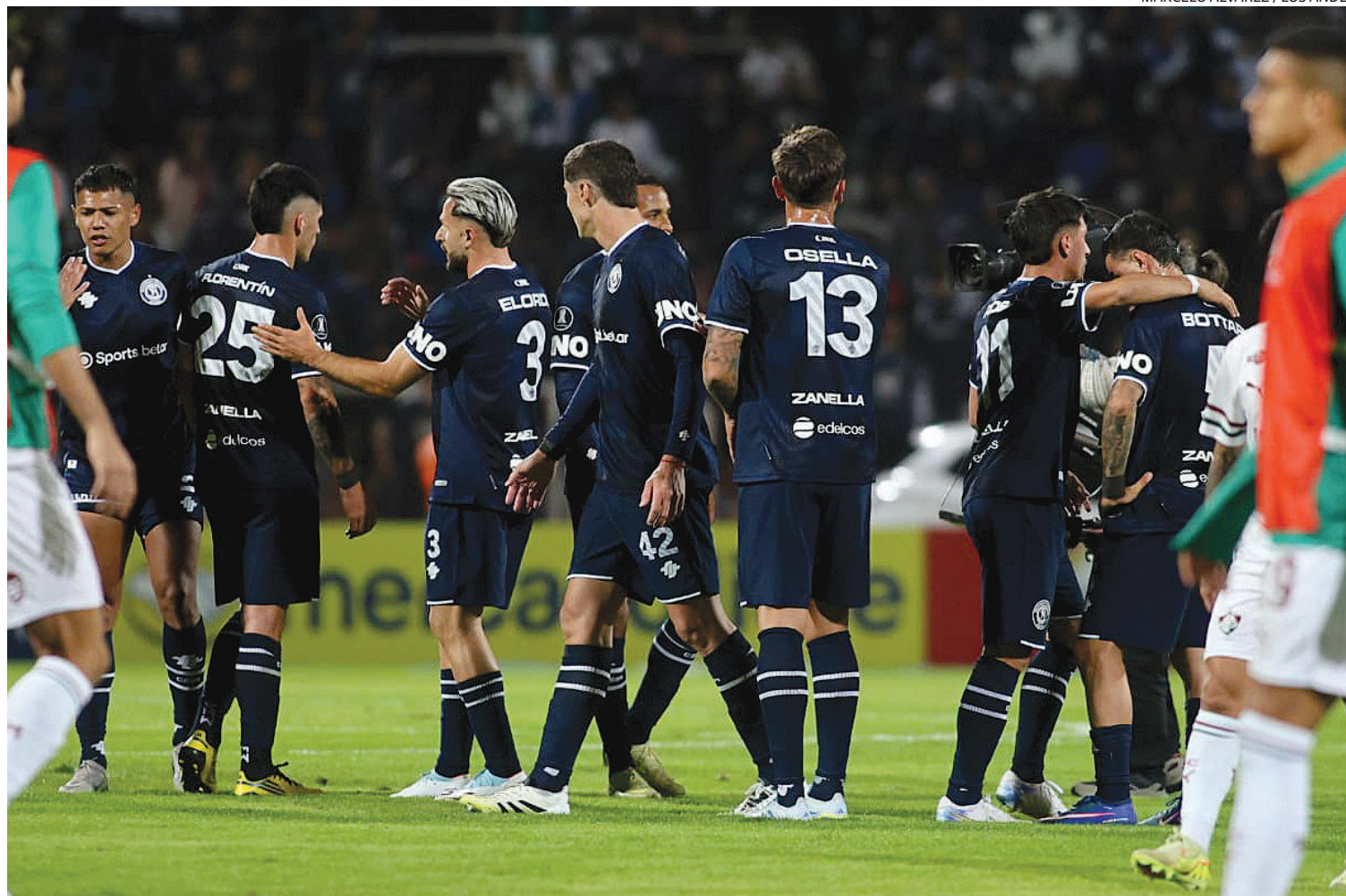
PROFESIONALISMO. Si algo tiene este equipo de Independiente Rivadavia, es sentido de pertenencia y un fuerte compromiso grupal.