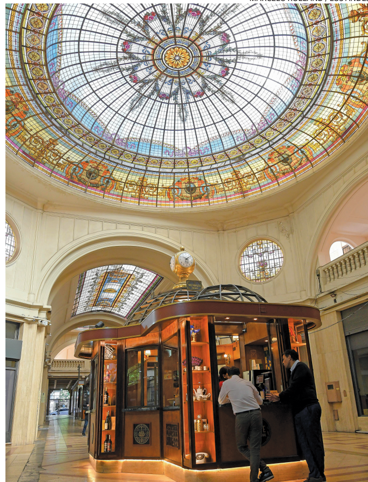
LUGAR DESTACADO. El café está ubicado bajo una de las cúpulas del Pasaje.