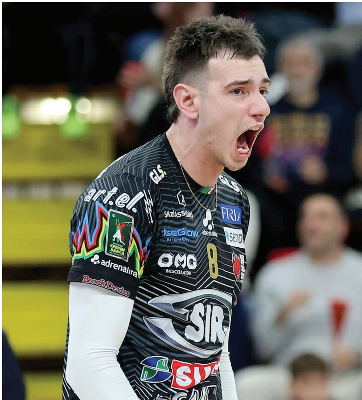
FENÓMENO. El central alvearense volvió a lo grande y se coronó.

Por eso, su regreso representa además una gran noticia para el entrenador del combinado nacional, Horacio Dileo, quien lo había convocado pese a las du-