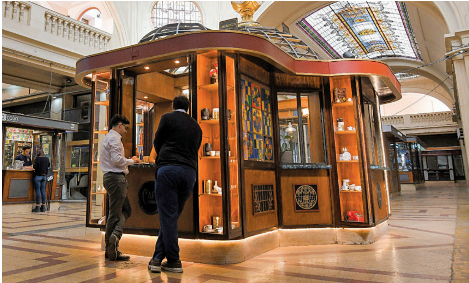
ELEGIDO ENTRE LOS MÁS BELLOS. El Café Mundial fue nominado en tres categorías de diseño gastronómico.