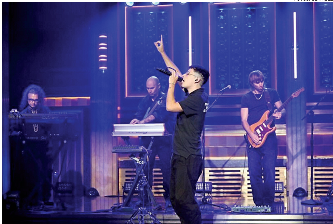
PERFORMANCE. Trueno, en un momento de su presentación para el programa de Jimmy Fallon.

El impactante show de Trueno en el show de Jimmy Fallon es sólo una cuenta más en el rosario exitoso de ascenso y visibilidad