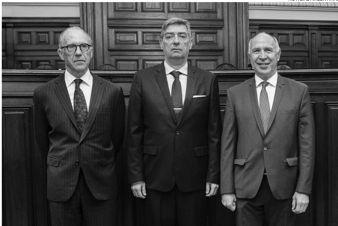
JUECES. Hubo unanimidad en el voto de Horacio Rosatti, Carlos Rosenkrantz y Ricardo Lorenzetti.

Sin embargo, los camaristas entendieron que se le debía dar el efecto devolutivo. Eso significa que mientras la Cá-