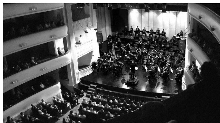
ORQUESTA. El organismo oficial ofrece un concierto esta noche.

El concierto propone un recorrido por tres obras cumbres de la historia de la música,