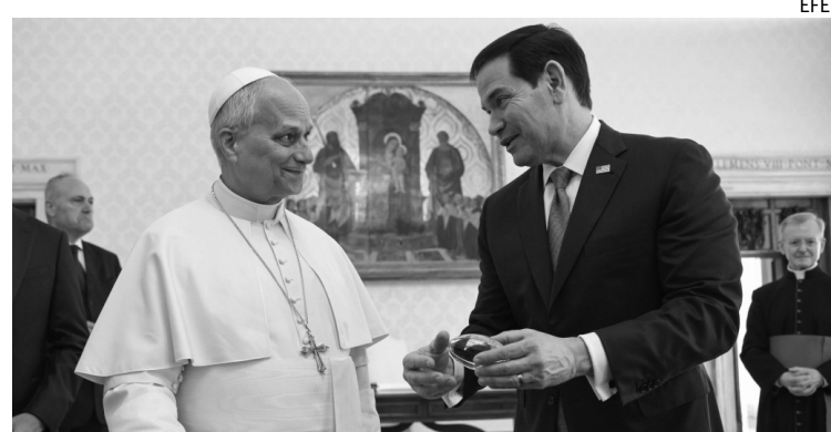
CORDIAL. Ambas partes coincidieron en una "simpática reunión".

Sus encuentros del año pasado, cuando Rubio y el vicepresidente Vance, católico convertido, asistieron a su toma de posesión el 8 de mayo de 2025, fueron muy positivos.