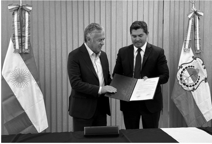
FIRMAS. Los gobernadores Alfredo Cornejo y Marcelo Orrego.