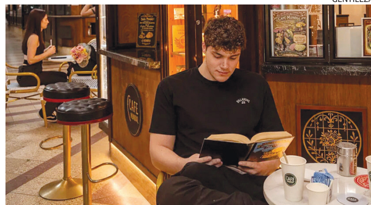
CULTURAL. Además de café, hay en el lugar libros y objetos culturales.