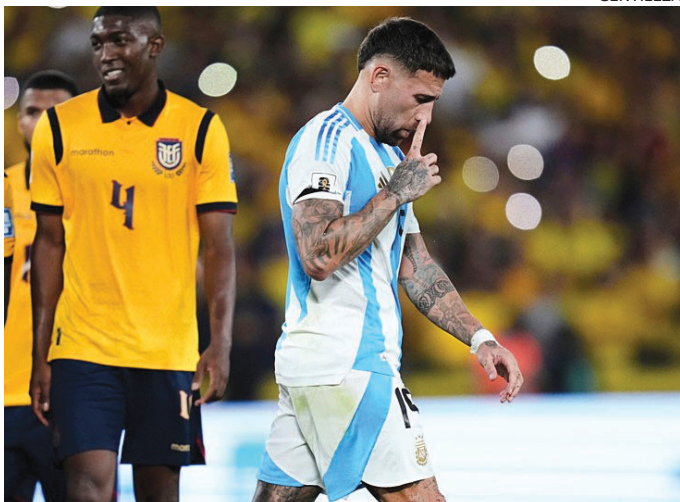
AFUERA. Otamendi vio la roja en el último juego de las Eliminatorias.

La AFA quiere que la FIFA aplique una amnistía para que Nicolás Otamendi pueda estar disponible para el debut frente a Argelia. "La Asociación del Fútbol Argentino mediante su Presidente, Claudio Tapia, llevó adelante gestiones ante el Bureau de la FIFA para que Nicolás Otamendi pueda ser elegible en el primer partido de la Copa Mundial de la FIFA 2026", indicó en un breve comunicado.