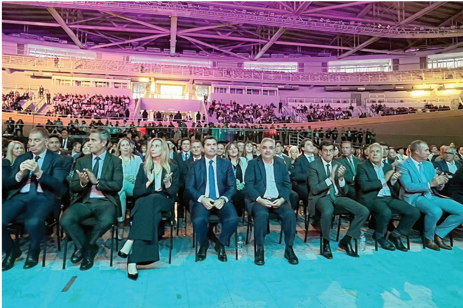
PRIMERA FILA. Funcionarios nacionales y gobernadores durante el acto por el Día de la Minería en San Juan.