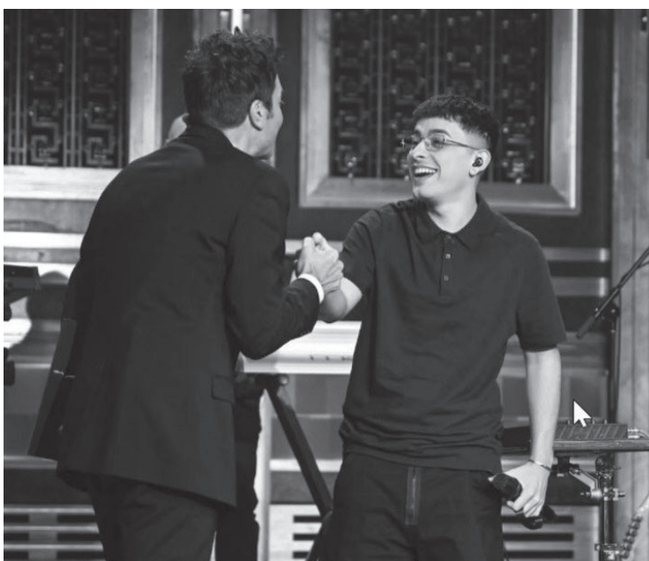
SALUDO. El conductor del programa, junto al oriundo del barrio de La Boca.

Bajo el concepto de que el éxito no debe medirse únicamente en cifras de reproducción, Milo J desplegó un repertorio que incluyó Recordé , Cuestiones , Solifican12 , Bajo de la piel , Niño y Luciernagas . En este marco, el artista de Morón dejó clara su procedencia y sus búsquedas artísticas: “Morocho color lodo, que aprendió a estar con nada y con un poco ya tiene todo”, declara en uno de los pasajes más potentes del show, sinteti-