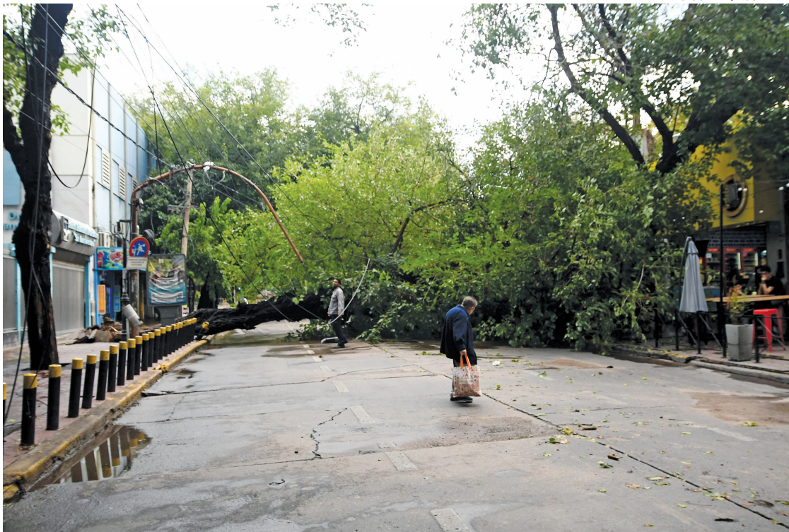
RAMIRO GOMEZ / LOS ANDES

Es esa área la que autoriza la erradicación, que depende de Ambiente y Recursos Naturales de la Provincia, ya sea por se-