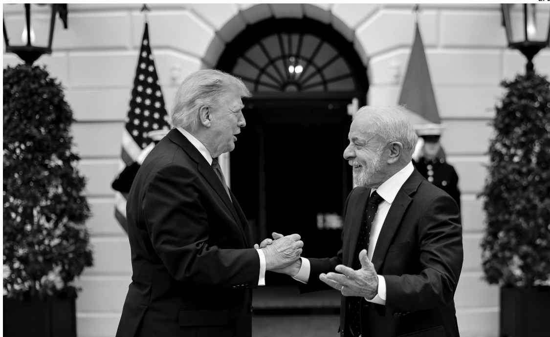
DIPLOMACIA. "Hablamos de muchos temas, incluyendo el comercio y los aranceles", resumió Trump.