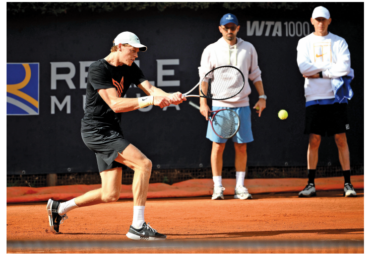
CERTEZA. "El tenis está superando al fútbol", dicen en Italia.