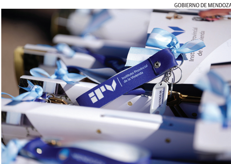
ARRAIGO. Buscan que los docentes vivan cerca de donde trabajan.