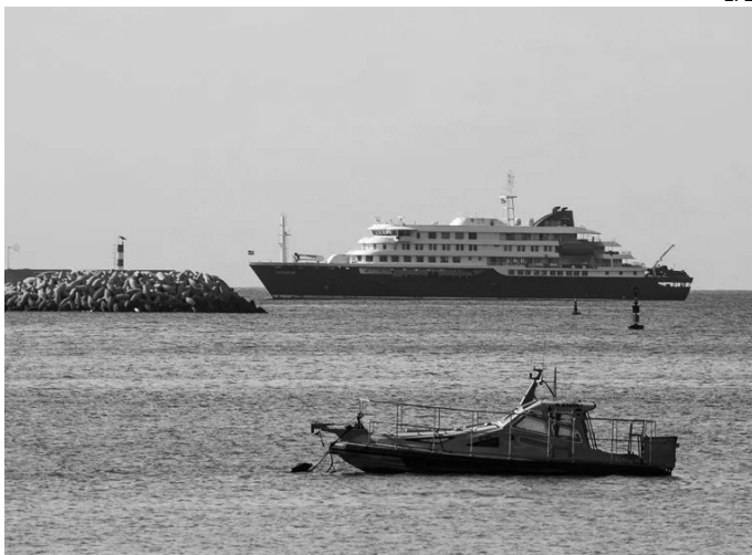
CHEQUEO. La OMS realiza una revisión de todos los pasajeros.

España acogerá al crucero con un brote de hantavirus a petición de la Organización Mundial de la Salud (OMS) en “cumplimiento del Derecho y el espíritu humanitario”. España también ha aceptado una petición de Países Bajos para acoger al médico del crucero MV Hondius, que se encuentra en situación grave, y que será transportado a Canarias en un avión. El barco se encuentra en Cabo Verde, donde ha recalado.