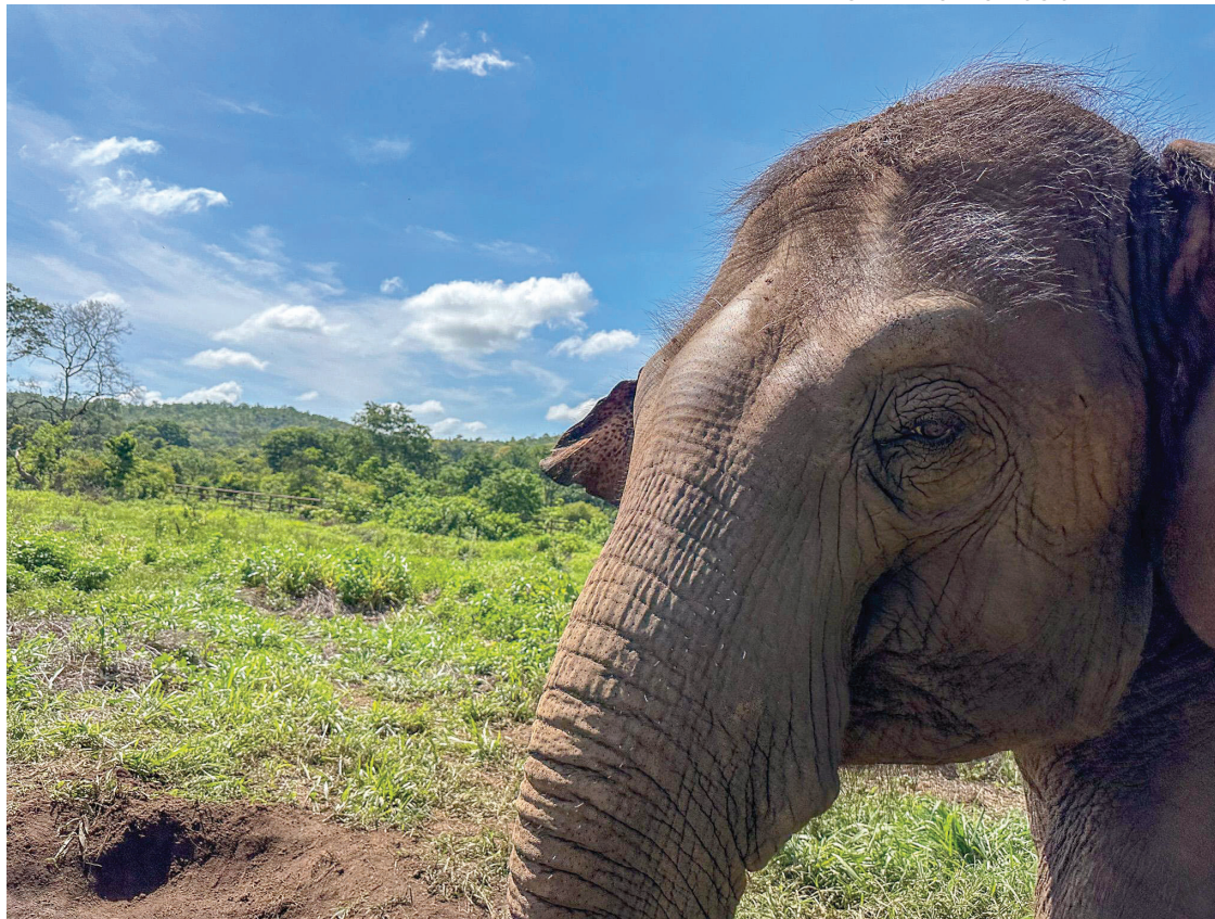
BIENESTAR. Guille, que en noviembre cumplirá 27 años, disfruta del entorno más cercano a su hábitat natural.

“Guille está muy bien, aprendiendo un montón de conductas de lo que es ser elefante y conviviendo con otras hembras. Ella es muy joven, es temperamental y tiene mucha energía, compa-