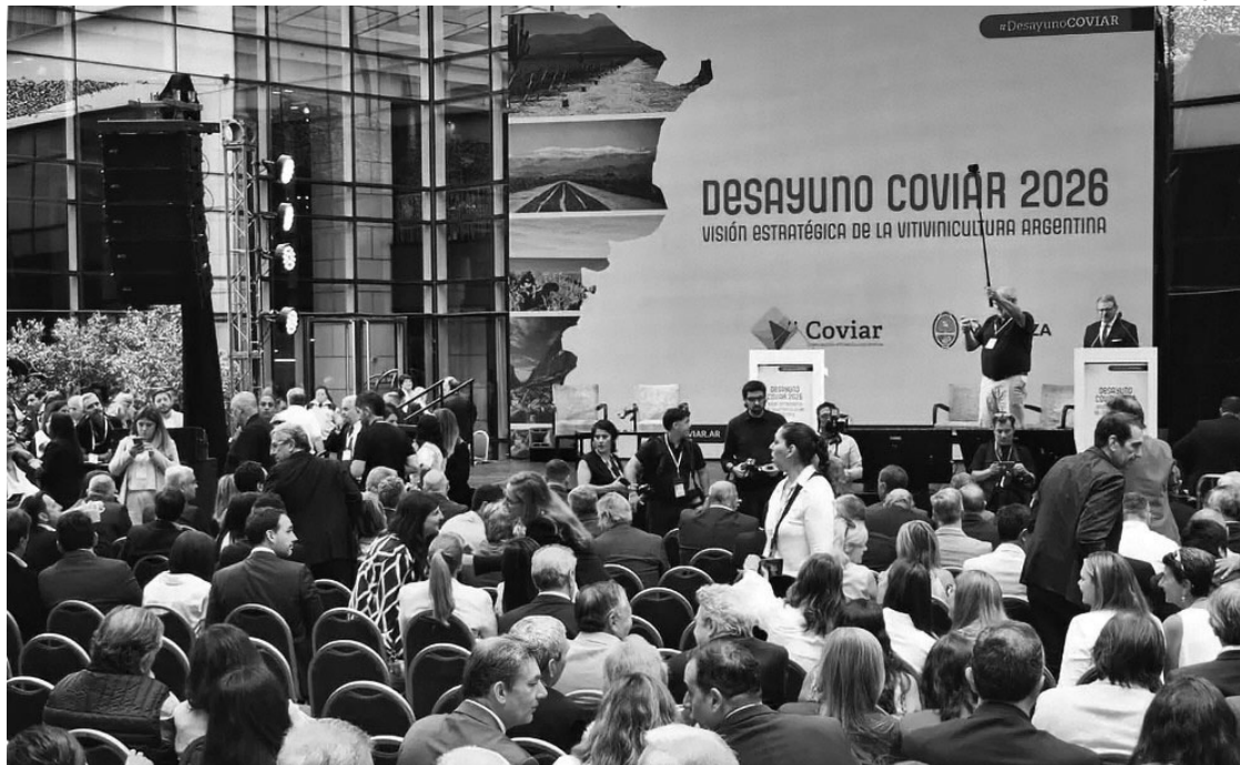
ASISTENCIA. Desde la Coviar se resalta que se destinaron U$80 millones del Proviar I a pequeños productores.

En la misma línea, el Centro de Viñateros y Bodegueros del Este se había retirado aún antes, en 2014. Desde entonces, sostiene una postura crítica sobre la continuidad de los aportes. Entre sus principales argumentos, señala que la Coviar no habría logrado cumplir con los objetivos del PEVI, tales como el posicionamiento de los vinos argentinos en mercados internacionales, la recuperación del consumo interno y la integración de pequeños productores. A esto se suma el