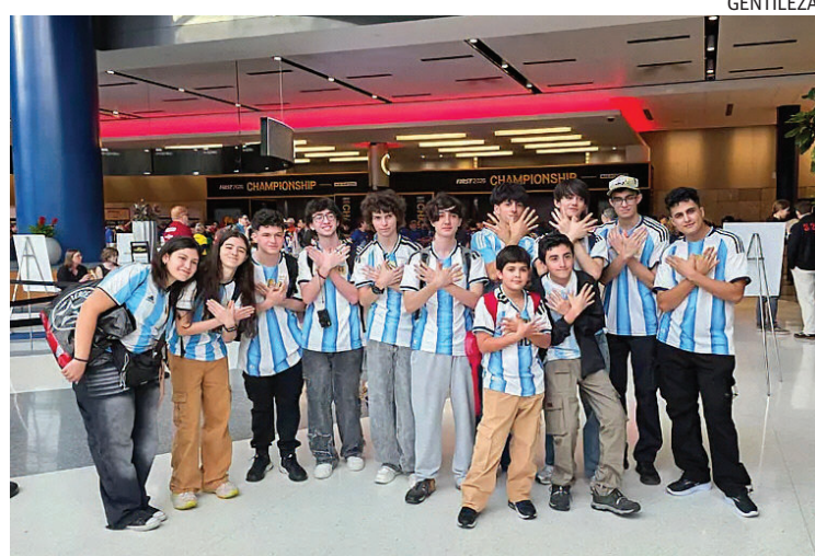
LOGRO. El equipo Kondor desarrolló el robot “GauchoBot”.

Gracias a sus sensores y cámaras de precisión milimétrica, el robot superó a naciones líderes en tecnología como Israel, quedando en el podio solo