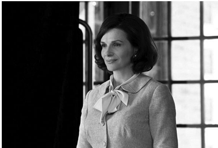
THE NEW LOOK. La experimentada Juliette Binoche protagoniza la serie.

En ese contraste, la serie convierte el uniforme en una herramienta narrativa donde cada detalle, mínimo pero preciso, define pertenencia, deseo y distancia social.