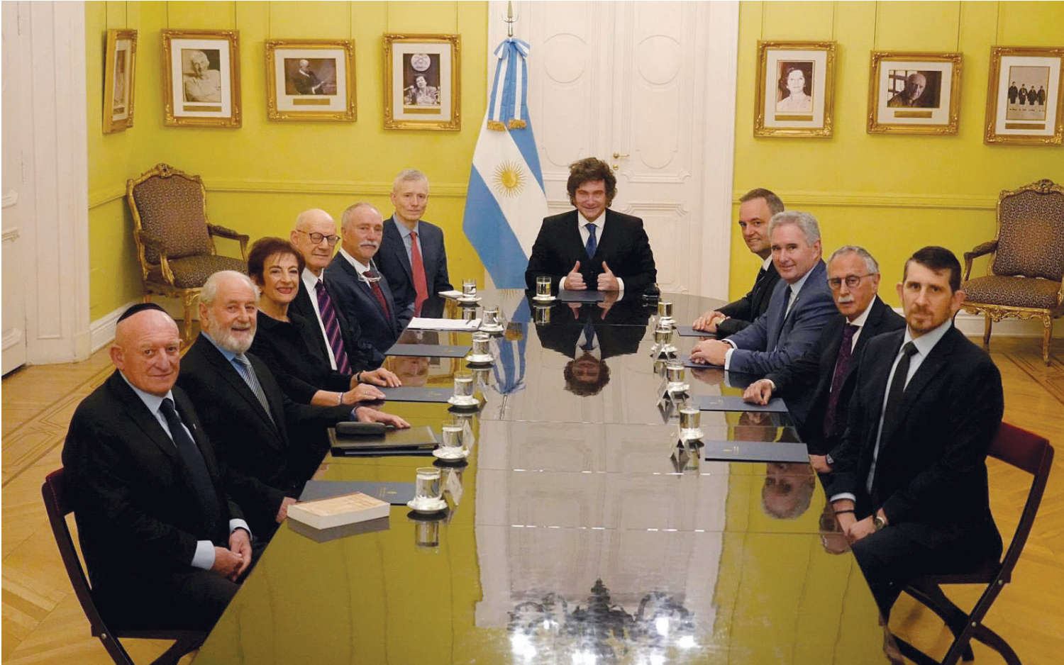
RESPALDO. El presidente, Javier Milei, se mostró ayer con su jefe de Gabinete, Manuel Adorni, en una reunión con representantes de una entidad judía.