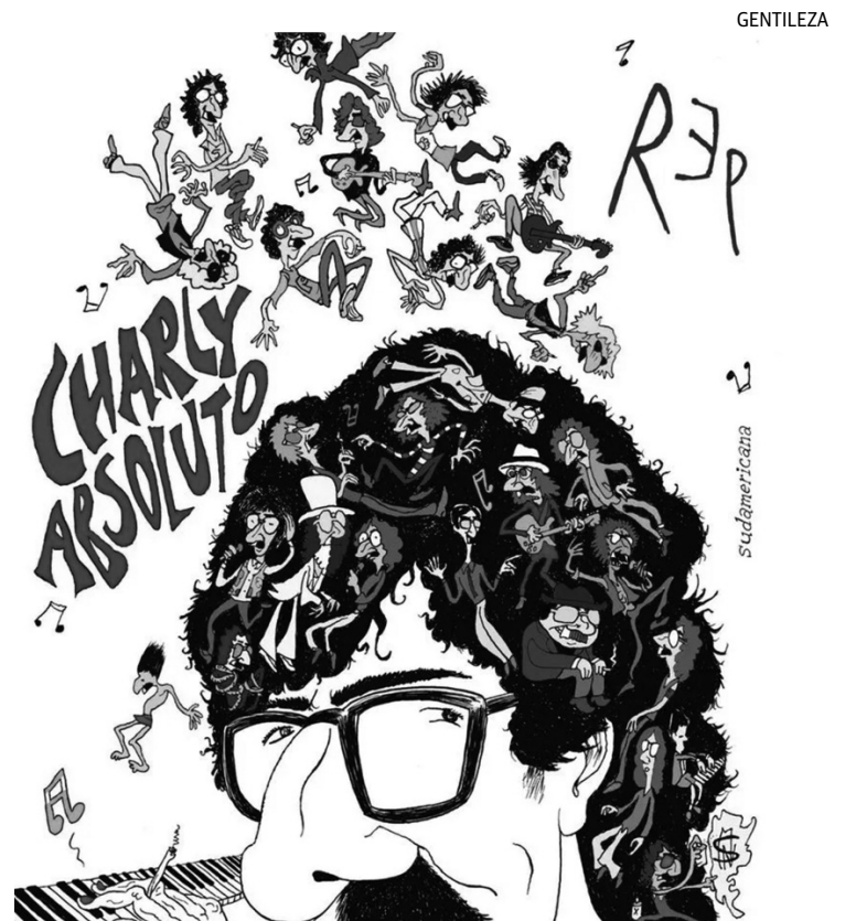
PORTADA. Así se presenta el libro de Miguel Rep.

La obra propone un viaje visual y conceptual que abarca desde los inicios de García en Sui Generis hasta su consolidación con Serú Girán y su carrera solista. A través de un enfoque lúdico y reflexivo, Rep construye un mapa del universo simbólico del músico, donde conviven referen-