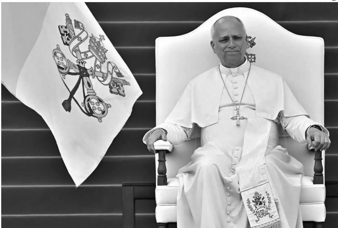
RESPUESTA. Tras los cuestionamientos, León XIV respondió que la misión de la Iglesia es “predicar la paz”.

El Vaticano, por su parte, mantiene un rol activo en instancias de mediación internacional, incluida la relación entre EE.UU. y Cuba. En ese marco, la Santa Sede aparece como un actor relevante en el seguimiento de los contactos entre Washington y La Habana.