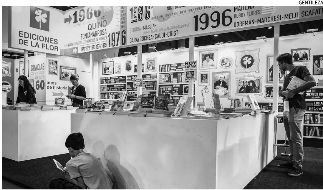
STAND. Así se despiden Ediciones de la Flor en la Feria del Libro de Buenos Aires.