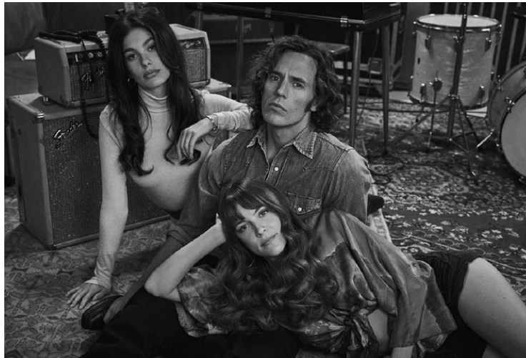
DAISY JONES & THE SIX. Habla de la moda a través del formato musical.