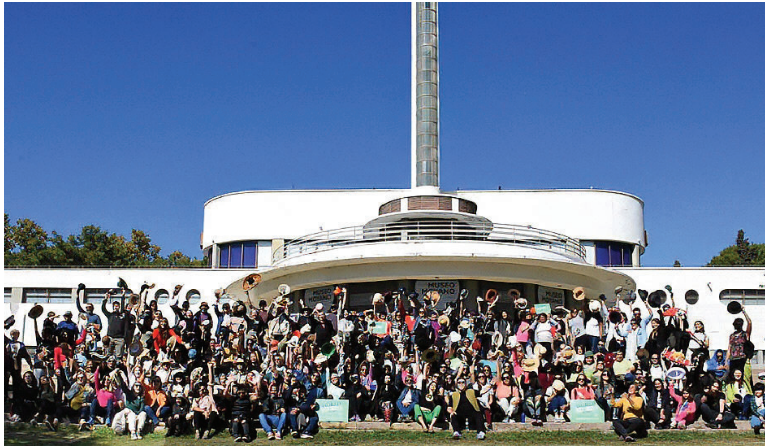
MULTITUD. Numerosas personas se reunieron el año pasado en la primera edición de Mendoza Hat Walk, que busca repetir el éxito.