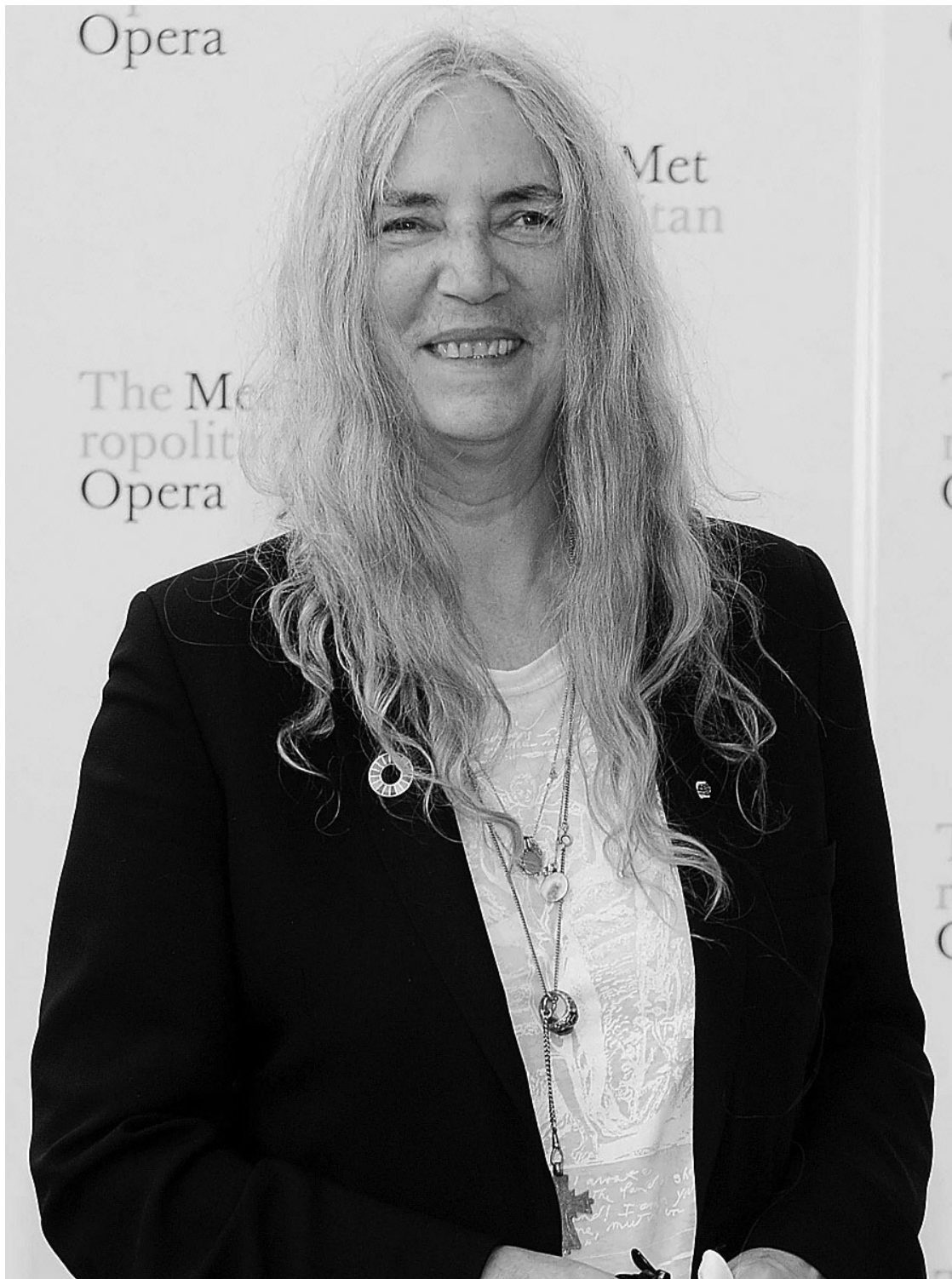
PATTI SMITH. La pionera del punk y una poeta admirada por generaciones.

Siempre combativa, Smith participó en las manifestaciones que pedían el fin de la guerra de Irak y la salida del presi-