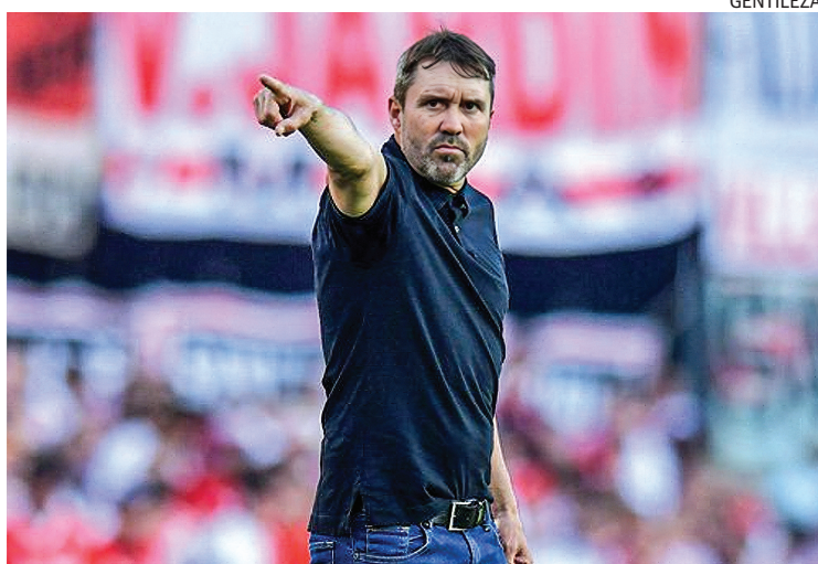
CONFIADO. Coudet mueve piezas para mejorar el equipo.

En cuanto al once, no habría demasiadas modificaciones con respecto al que venció 3 a 1 al Tiburón en Núñez, pero podría meterse Kendry Páez