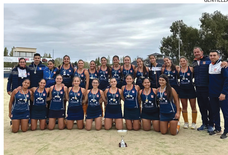
AUTORIDAD. El equipo de C. D. Rivadavia es el campeón del Regional.

Cabe destacar que el gran favorito para llevarse la copa era el subcampeón, pero jugando un