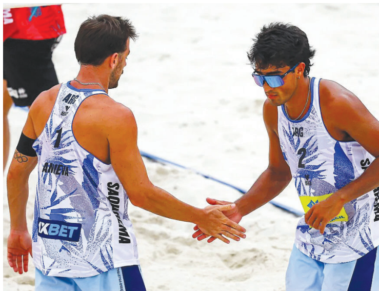
TALENTO. La dupla quiere seguir creciendo en su juego.

La final de Circuito Sudamericano de beach vóley se definió en un tercer set, con parciales de 18-21, 23-21 y 15-12.