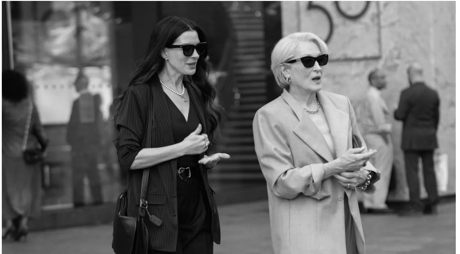
PROTAGONISTAS. Las talentosas Meryl Streep y Anne Hathaway, en una escena de "El diablo viste a la moda 2".

Además del cuarteto protagónico, la producción incorpora nombres como Kenneth Branagh, Simone Ashley, Lucy Liu,