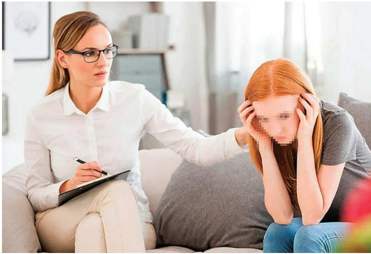
CAMBIO. La iniciativa integra las adicciones en políticas de salud mental.

La propuesta fue presentada en el Congreso Argentino de Psiquiatría y Salud Mental, que se realizó en Mar del Plata del 22 al 25 de abril. Habla de “afección o trastorno de salud mental” y no de padecimiento. Además, ratifica las adicciones como parte integrante de las políticas de salud mental, debiendo abordarse según la singularidad de cada persona.