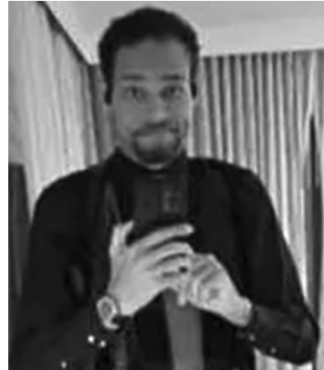
EVIDENCIA. Fotografía de Cole Allen en poder de la Justicia.

Allen el 21 de abril emprendió un viaje en tren desde Los Ángeles, y cruzó el país con varias armas: una escopeta calibre 12, una pistola calibre 38, munición, dos cuchillos y cuatro dagas.