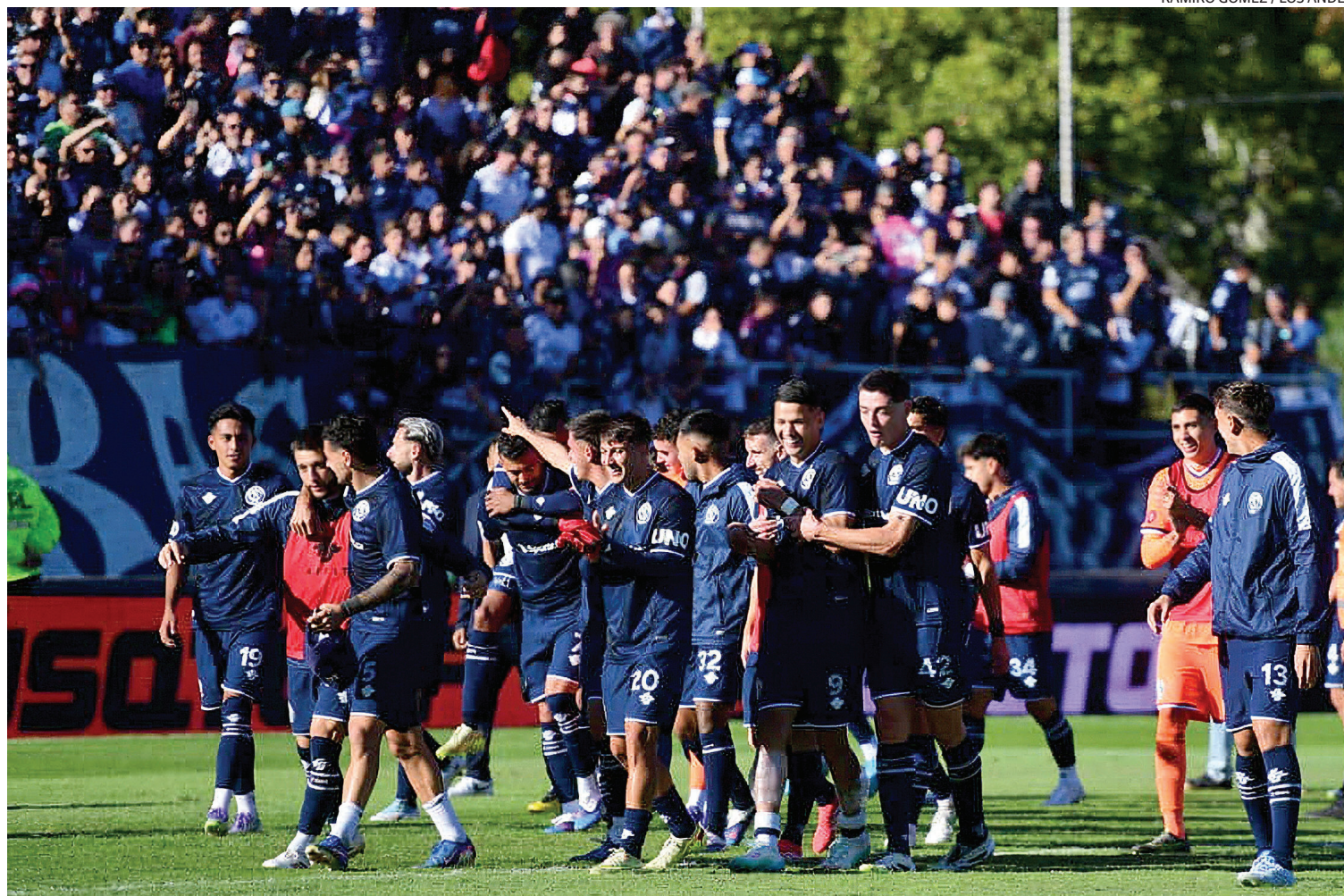
PRACTICIDAD. Independiente Rivadavia se volvió la sensación de fútbol argentino y quiere seguir de racha en la Copa.