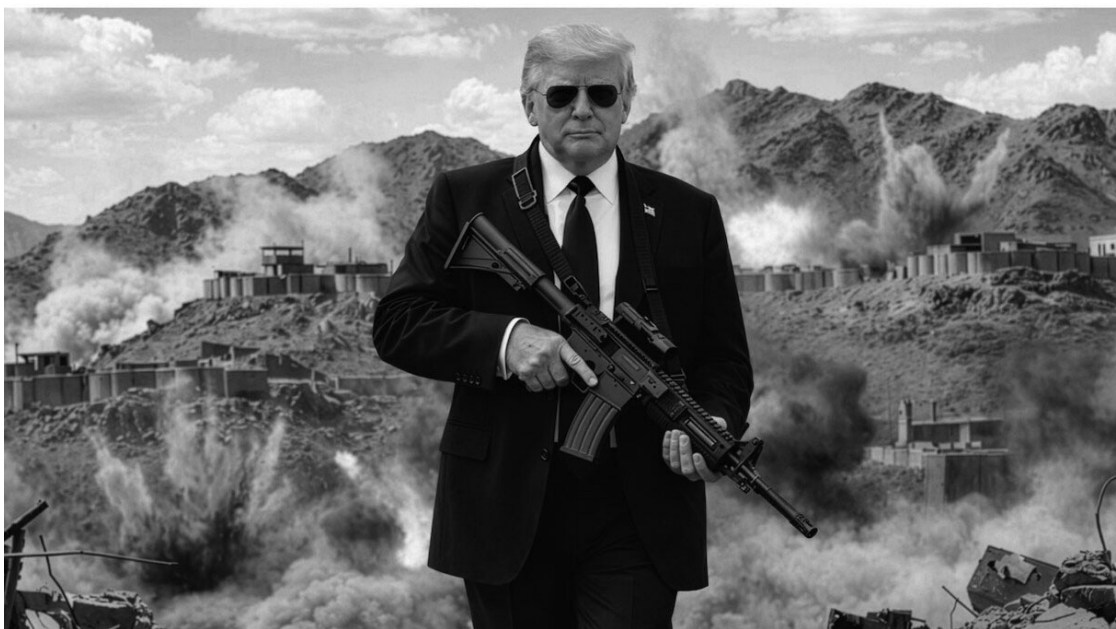
POCO AMABLE. Imagen que fue compartida por el presidente de EE.UU., Donald Trump, en su red Truth social.