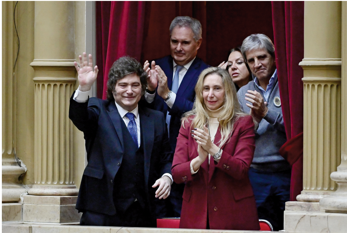
RESPALDO PLENO. El presidente, Javier Milei, su hermana Karina y ministros en uno de los palcos del Congreso.