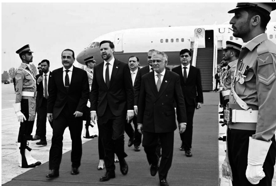
COMITÉ. JD Vance (al centro), junto al jefe de las Fuerzas de Defensa de Pakistán, a su llegada a Islamabad.

Según el mandatario, que una vez amenazó con aniquilar «toda una civilización» si Irán no reabría el estrecho de Or-