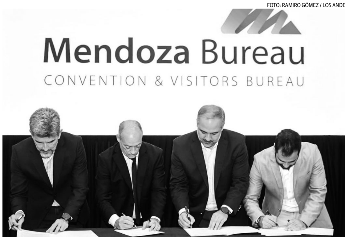
INICIATIVA. El evento se realizó en el Hotel Hilton, con autoridades, empresarios y referentes del sector.

Uno de los ejes centrales es la articulación público-privada, que permite unir recursos, conocimiento y capacidad de gestión. Esto resulta clave para que Mendoza pueda posicionarse como sede de grandes congresos y eventos, en un contexto donde otros destinos también compiten por ese mercado.