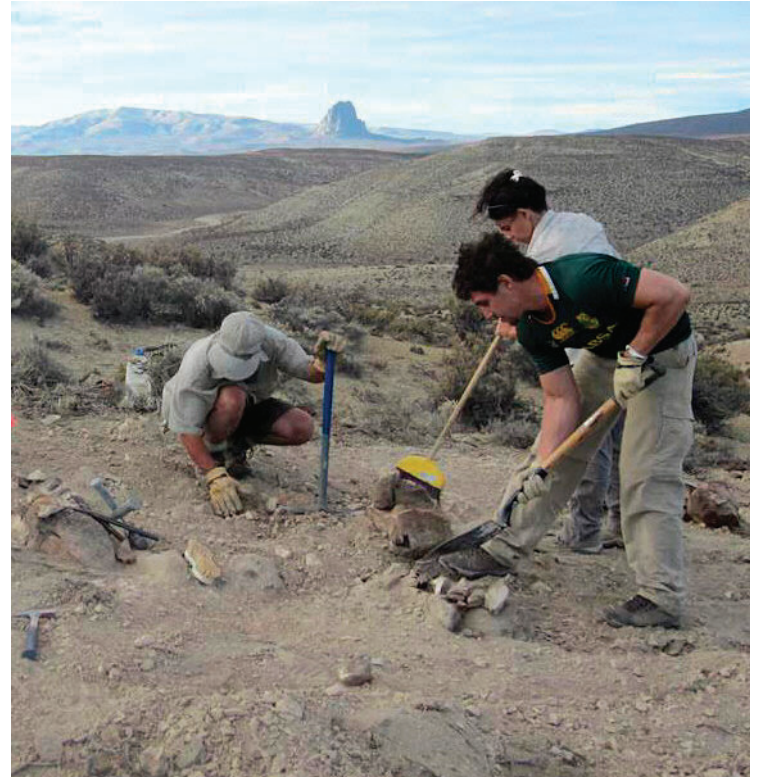
EXCAVACIÓN. Así se recuperaron vértebras y partes del sacro y la cola.

en el campo. “Cada vez que íbamos, nos decía ‘Acá hay un bicharraco’ y nos llevaba a lugares con fósiles muy impor-