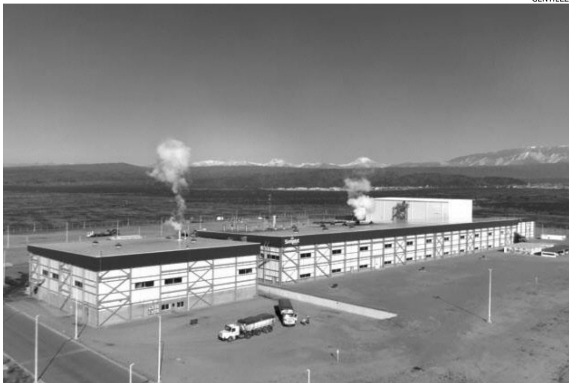
EN CACHEUTA. Irrigación regularizó dos pozos que ya operaban bajo "tolerancia administrativa".

tes, la empresa ya utilizaba el recurso sin contar con el título concesional, en el marco de lo que Irrigación calificó como una "tolerancia administrativa".