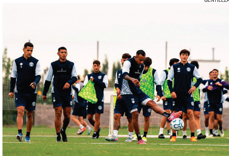
CONFIADO. Independiente Rivadavia es el mejor equipo del torneo local.