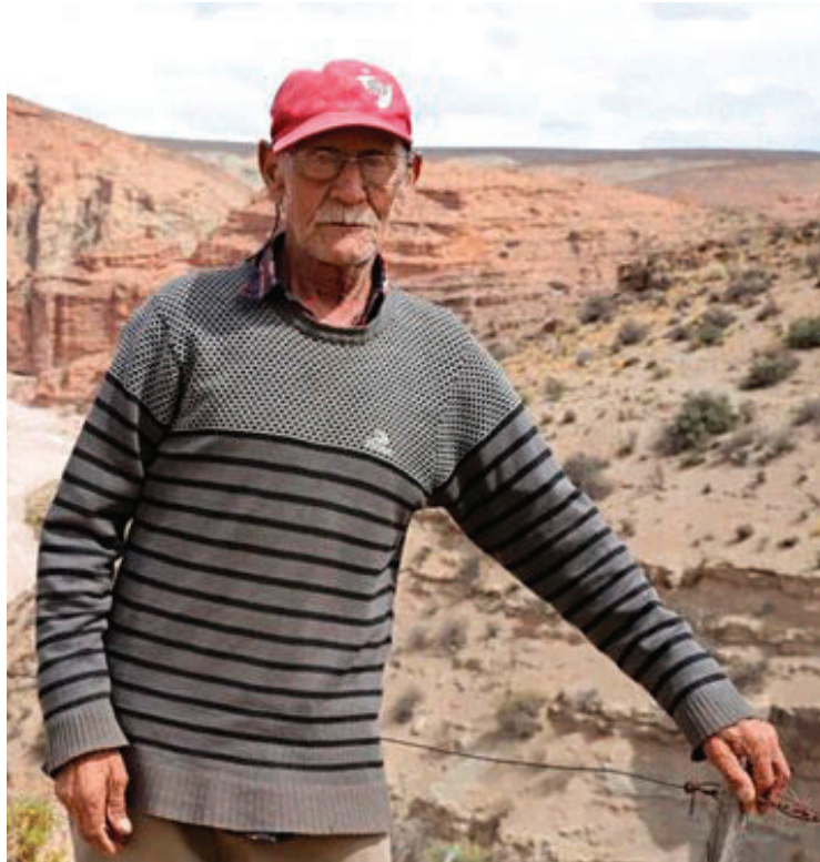
DIONIDE MESA. El baqueano conocía a los fósiles como “bicharracos”.