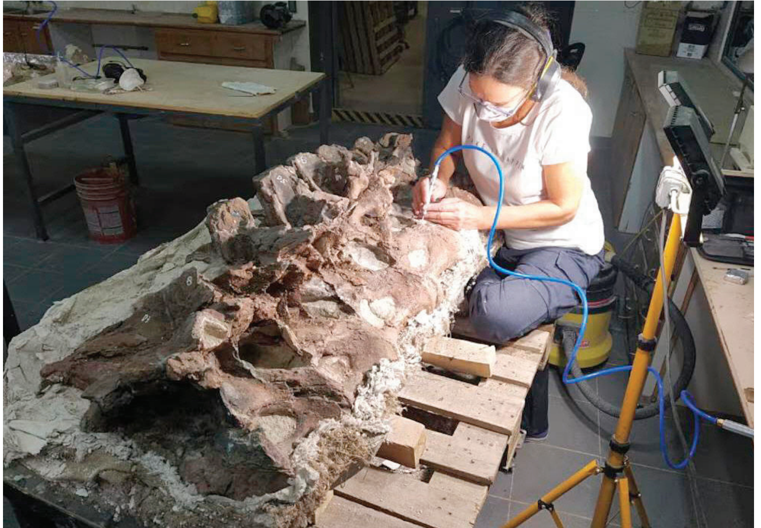
FÓSILES. Están siendo investigados por científicos del Conicet y del Museo Paleontológico Egidio Feruglio.

ARQUEOLOGÍA. Los fósiles, encontrados por un baqueano y un equipo de paleontólogos del Conicet, pertenecieron al “Bicharracosaurus”, y tendrían 160 millones de años. El animal llegó a medir 20 metros.