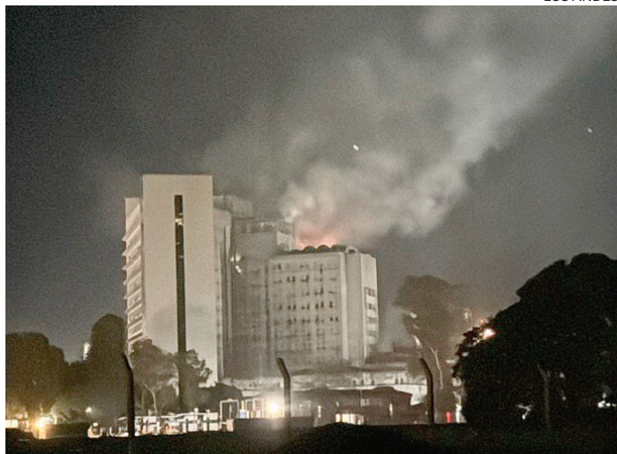
EDIFICIO LIBERTAD. El fuego se inició en un depósito del piso 12.

Un incendio se registró en el Edificio Libertad, en Retiro. Hubo despliegue de bomberos y servicios de emergencia. El siniestro obligó a evacuar a 75 personas y dejó al menos 5 afectados por el humo. El foco ígneo se inició a las 20 en el piso 12, en un depósito de materiales, y se propagó hacia el 13. El edificio es la sede del Estado Mayor General de la Armada Argentina.