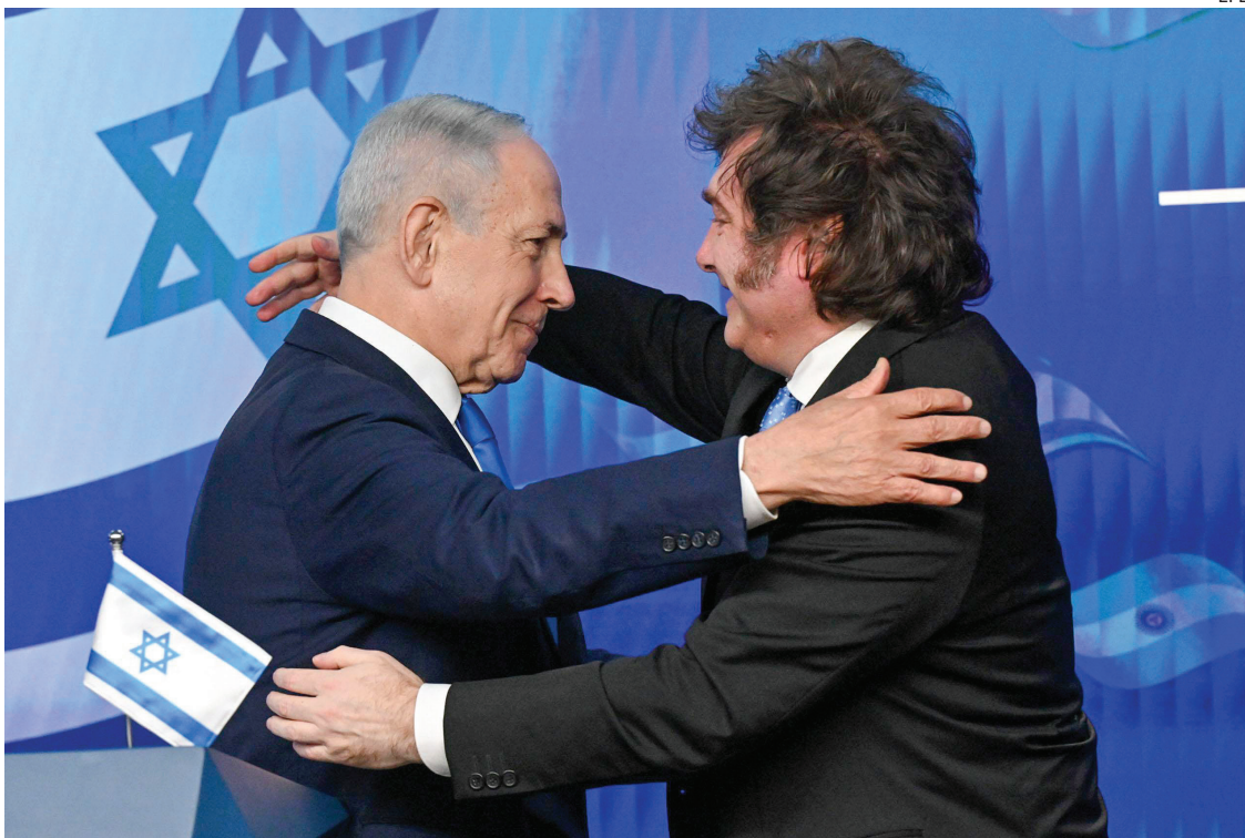
COOPERACIÓN. El primer ministro israelí, Netanyahu, y el presidente, Milei, firmaron los "Acuerdos de Isaac".