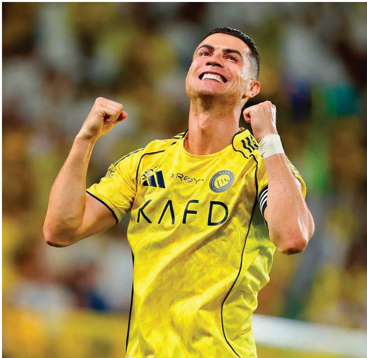
UNA BESTIA. Cristiano Ronaldo, a sus 40 años, lidera la tabla con 968 goles.

ahora, se encuentra más cerca del objetivo de los cuatro dígitos, una marca inédita en la historia del fútbol profesional. Una cifra tan extraordinaria como los registros que ambos futbolistas siguen ampliando desde su debut, temporada tras temporada.