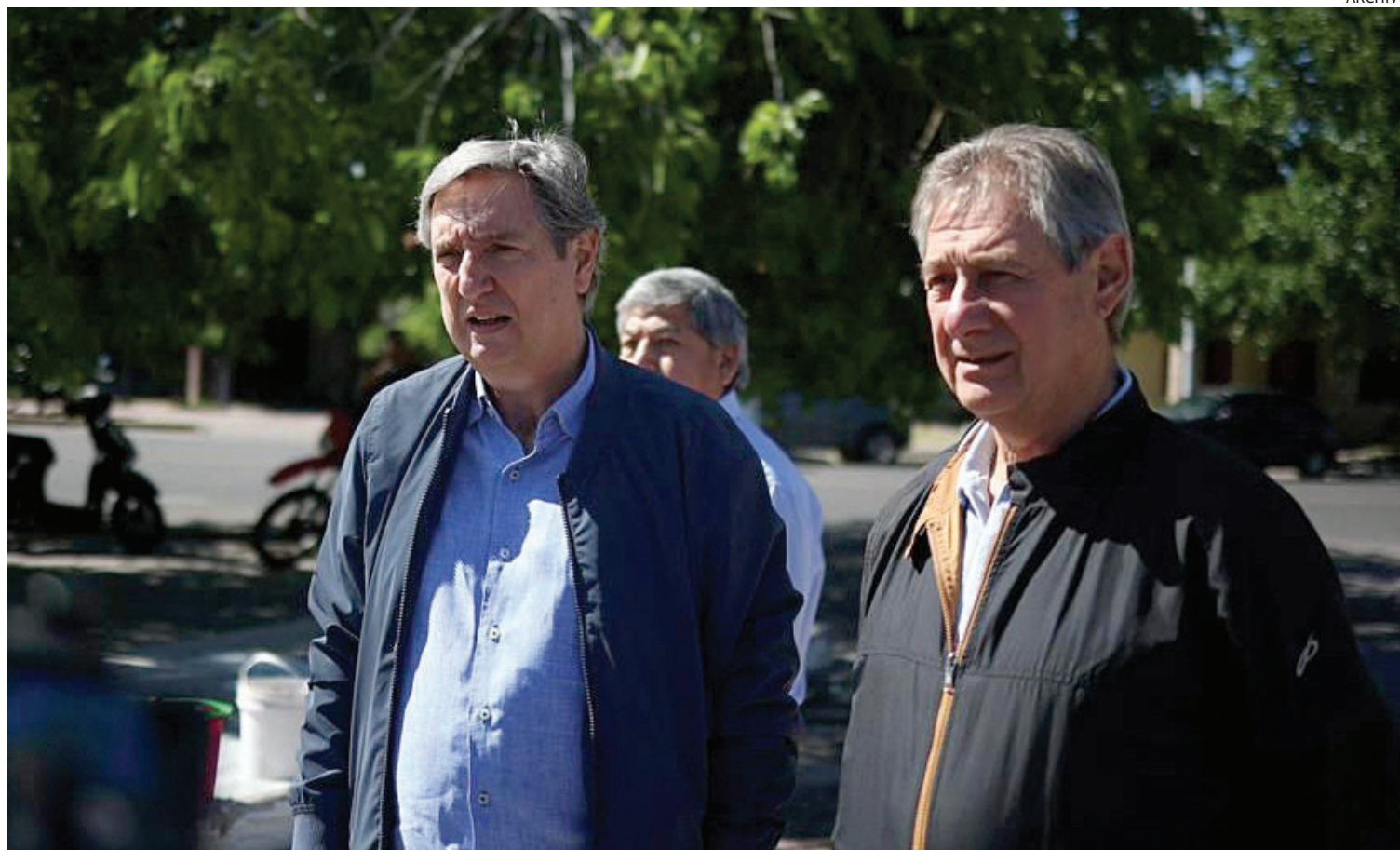
DISPUTA. El conflicto de poderes que planteó el Ejecutivo ante la Corte ha tenido como efecto una medida de "no innovar" en la Justicia.