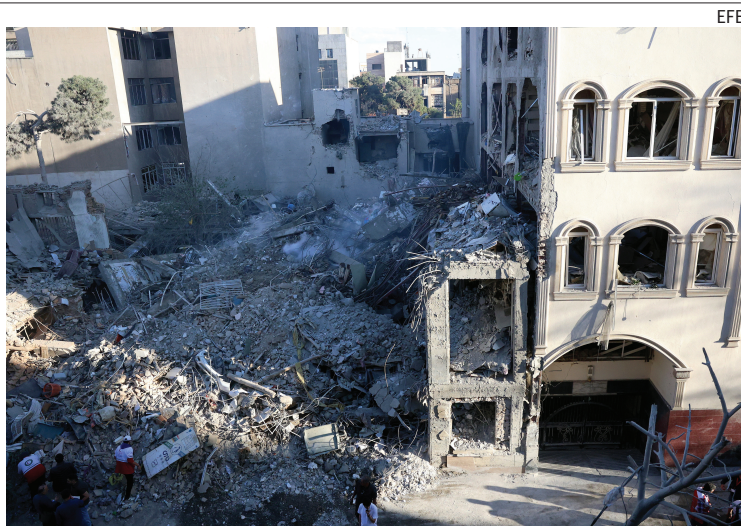
FRAGILIDAD. La situación en Medio Oriente preocupa.

Mientras, la agencia de prensa iraní Tasnim afirmó, citando una fuente anónima, que "mientras Estados Unidos no respete su compromiso con el alto el fuego en Líbano y el régimen sionista continúe sus ataques, las nego-