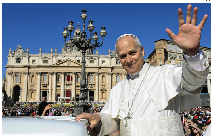
ILUSIÓN. Entre desafíos y fe, León XIV emprende su primer viaje por África.

El estadounidense-peruano Robert Francis Prevost, quien asumió como León XIV, afrontará realidades complejas. Señala la Santa Sede que se trata de tierras "heridas por violencias, fundamentalismo y la tragedia de las migraciones", pero también "caracterizadas por el en-