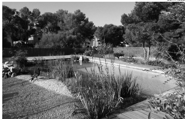
ORGÁNICO. Los espacios verdes aportan diseño y abrazan el paisajismo.

El contenido del encuentro se centra en la incorporación de nuevas formas de producción y en la adaptación del sector a