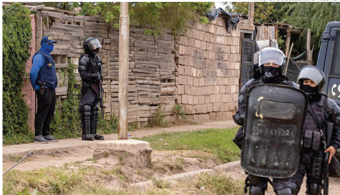
CAPTURA. El sospechoso cayó durante un megaoperativo realizado por la Policía el último jueves.

VIOLENCIA. El joven de 17 años detenido en el barrio La Gloria fue imputado por intento de homicidio de la pequeña y del hermano.