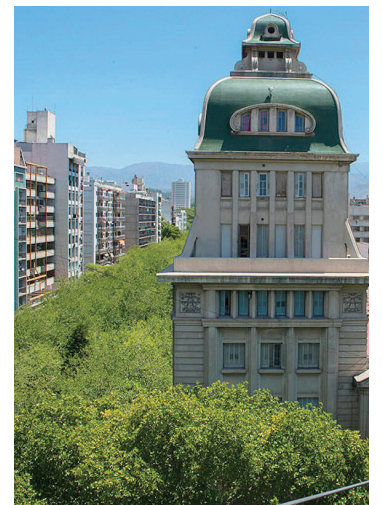
ÁRBOLES. Emblemas de la ciudad

SOSTENIBILIDAD. Las propuestas de especialistas del Conicet abordan temas vinculados al piedemonte, la biodiversidad y el arbolado.