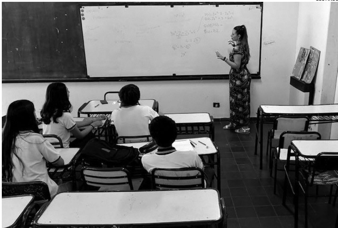
BAJO. En Mendoza, el porcentaje de alumnos con 15 faltas o más pasó de 48% en 2022 a 49% en 2024.

El ausentismo de los estudiantes fue considerado como uno de los mayores problemas por los directores consultados: 47% de los directores argentinos considera que el ausentismo limita el aprendizaje. Es seguido