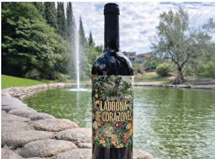
DEBUT. La aceitera llega al mercado con tres vinos ideados por Guardia