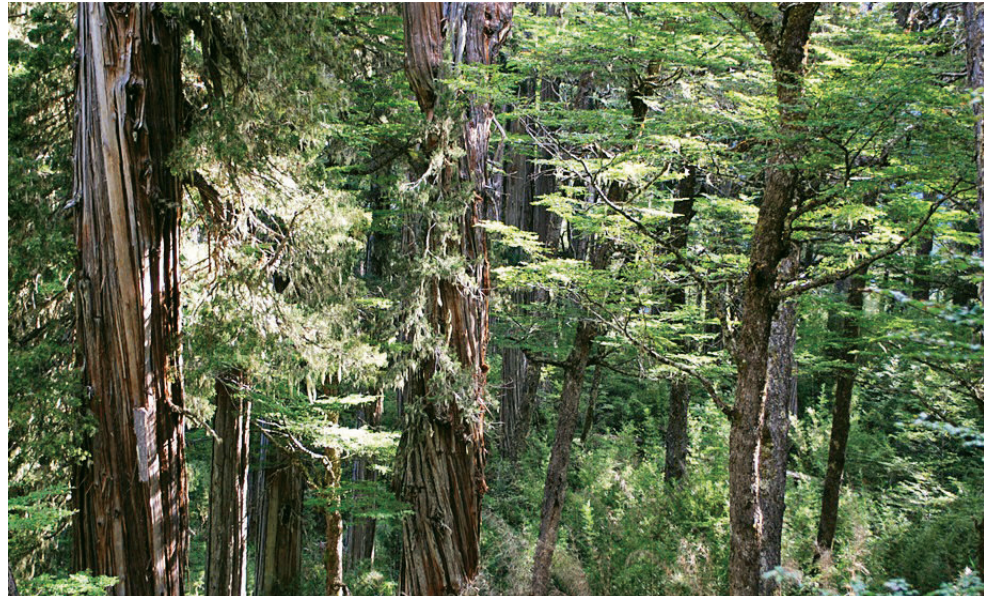
RIQUEZA VEGETAL. Bosque de lengas de la zona del Tronador, una montaña volcánica, ubicada en la cordillera de los Andes, Parque Nacional Nahuel Huapi.