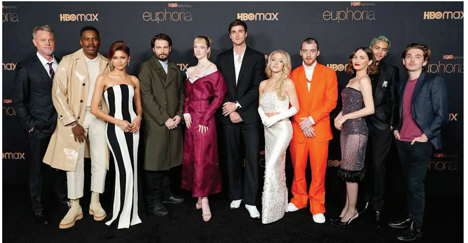
ELENCO. Con algunos regresos y la confirmación de Zendaya, Sweeney y Elordi, llega “Euphoria” con su tercera temporada.