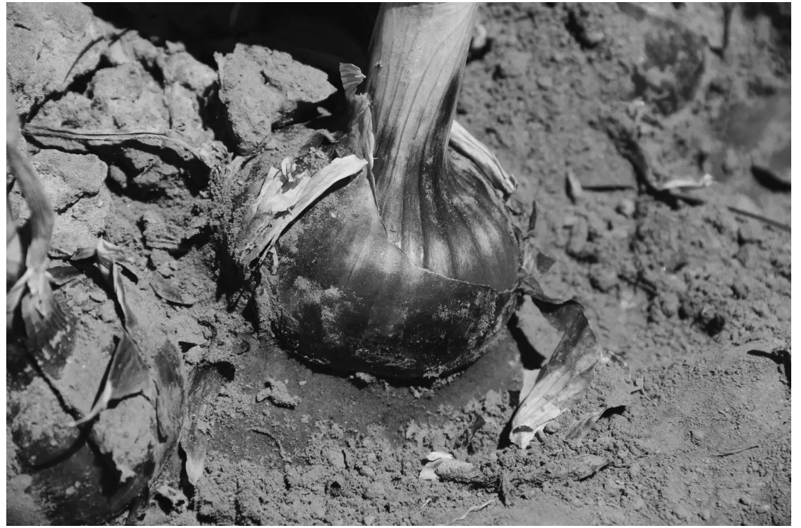
CARACTERÍSTICAS. La variedad Tinta INTA se destaca por un calibre de hasta 12 cm, color intenso y baja pungencia.

La baja pungencia y el buen contenido de sólidos solubles son dos características que le