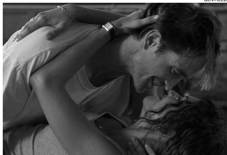
PAREJA. Robert Pattinson y Zendaya en "El drama".

Estados Unidos, 2026. Título original: "The Drama". 106'. De: Kristoffer Borgli. Con: Zendaya, Robert Pattinson, Alana Haim, Mamoudou Athie.