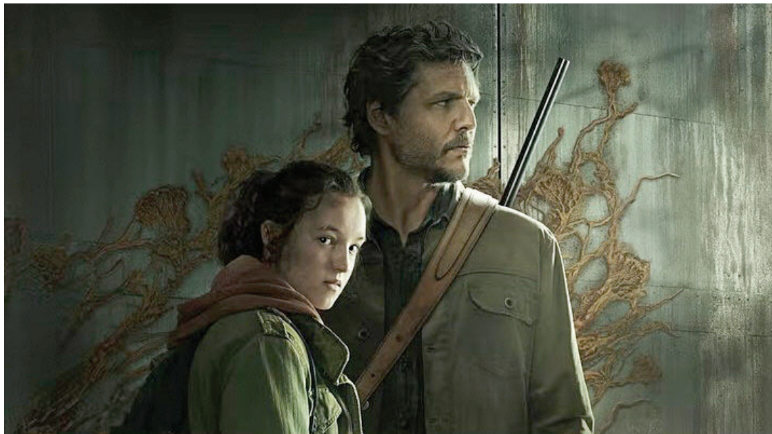
THE LAST OF US. Con esta serie, HBO ha vuelto al modelo de lanzar un episodio por semana.

Un informe de Nielsen Streaming Content Ratings detectó que la cuarta temporada de Stranger Things generó uno de los picos de consumo noctur-