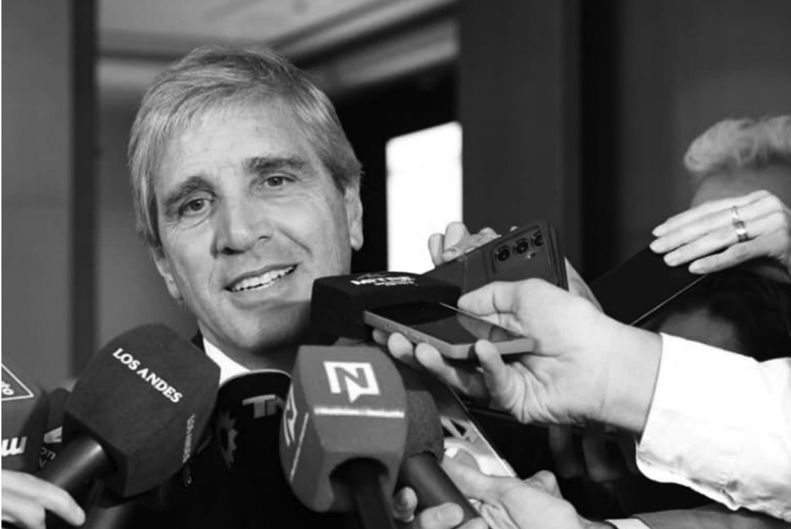
SINCERAMIENTO. El ministro de Economía reconoció el impacto en los precios de las subas de las naftas.