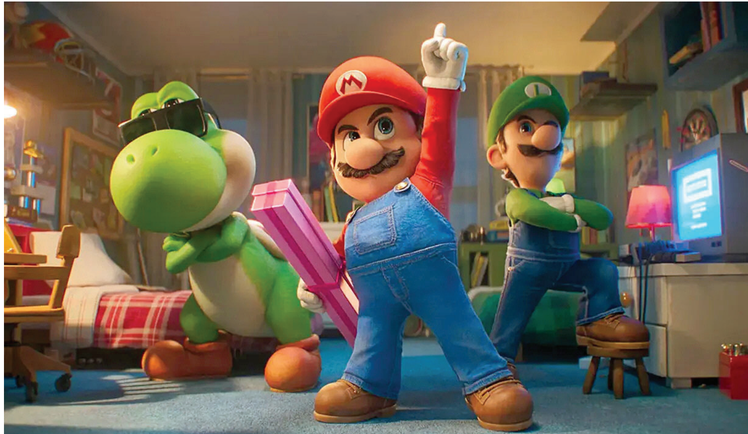
AVENTURAS GALÁCTICAS. En esta película, el famoso personaje de Mario vive una aventura más ambiciosa que otras.

ESTRENO. El universo cinematográfico de Nintendo se expande con la llegada de esta película a todos los cines de todo el mundo, incluyendo las salas de Mendoza.