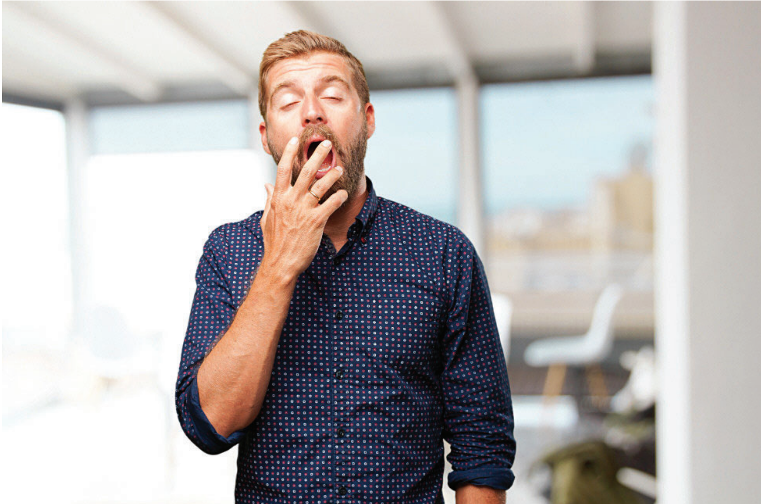
CAMBIO DE ESTACIÓN. En algunos países lleva a un cambio de huso horario. La variación de las horas de luz influyen en el sueño.