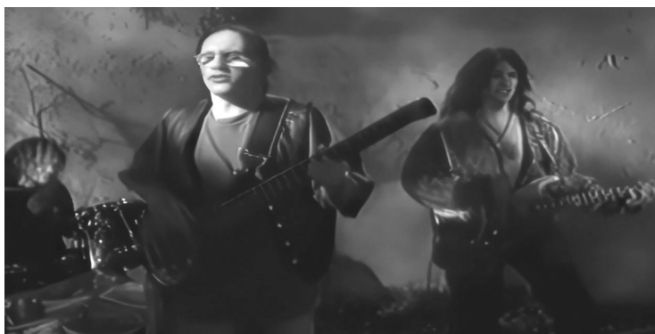
VIDEO. Una imagen del clip con que los Enanos promocionaron el tema.

En esa carrera silenciosa hasta llegar a los mil millones, Lamento boliviano dejó atrás incluso a temas de figuras icónicas del rock argentino como Gustavo Cerati, Andrés Calamaro o Fito Páez. Pero la comparación queda chica: Lamento boliviano es de las canciones que ya no pertenecen a nadie. Tanto así que, para muchos, su propia creación podría resultar una sorpresa.