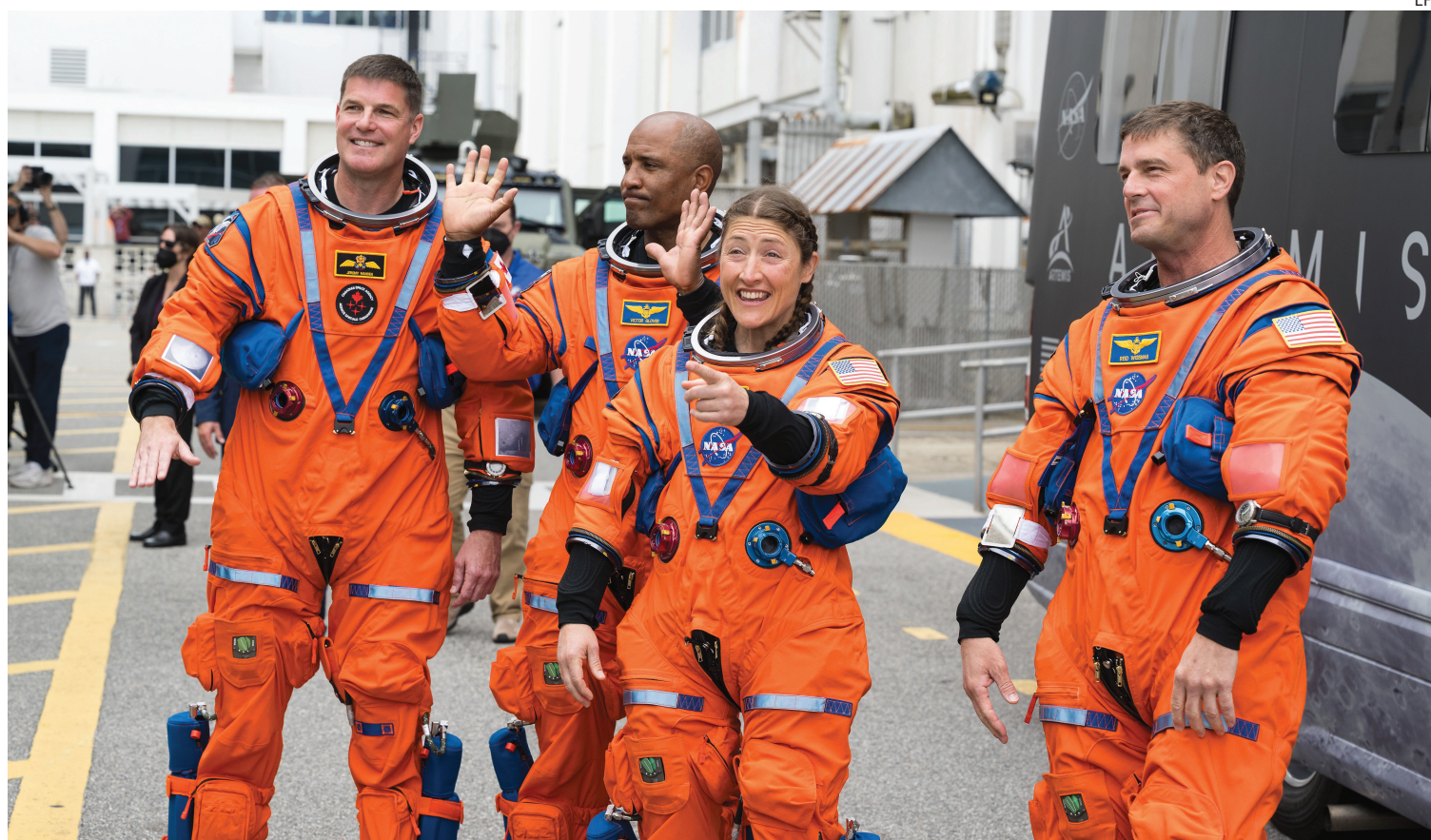
EN CAMINO. Los astronautas Reid Wiseman, Christina Koch, Victor Glover y Jeremy Hansen, listos para abordar su nave espacial Orión.

CARRERA ESPACIAL. Con cuatro astronautas a bordo, la nave Orión inició un viaje de 10 días alrededor de la órbita lunar. Es un hito clave para el regreso humano al satélite natural y futuras misiones a Marte.