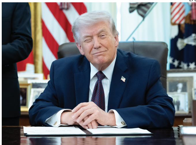
EVALUACIÓN. Trump prevé retirarse de Irán en "tres semanas".

"El nuevo presidente del régimen iraní, jacobino, pedirá un alto al fuego", aseguró Trump en la plataforma Truth Social. Pero poco después llegó la respuesta desde Irán, tachando esta afirmación de "falsa e infundada".