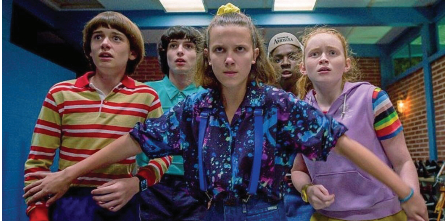
STRANGER THINGS. La serie de Netflix fue una de las que llevaron a sus seguidores a hacer maratones para verla.

A eso de las dos de la mañana, cuando la ciudad ya bajó el volumen y las notificaciones del trabajo dejaron de llegar, alguien aprieta “siguiente episodio”. La escena se repite en miles de casas: quien había prometido ver solo un capítulo más descubre que el reloj avanza sin piedad de madrugada. Este fenómeno, aunque no es nuevo, se encuentra cada vez más extendido y revela hasta qué punto las plataformas de streaming han cambiado el vínculo entre el público y el tiempo.