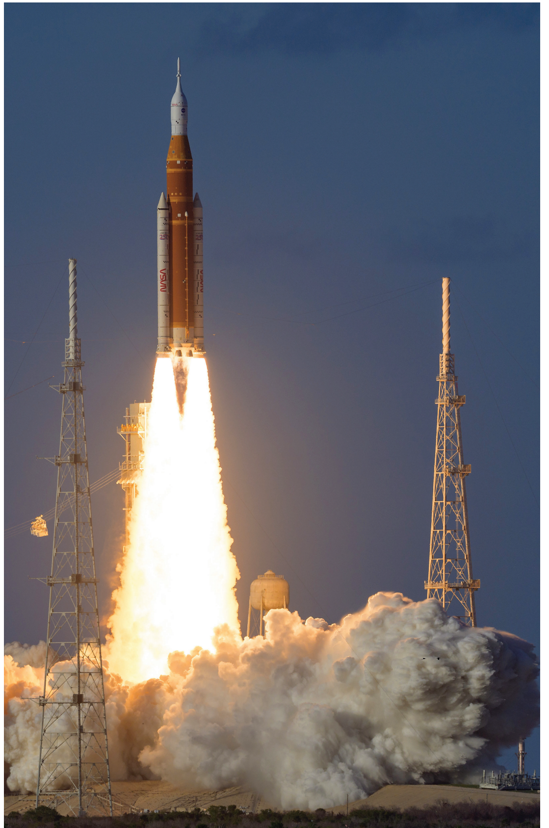
LANZAMIENTO. El cohete despegó del centro espacial ubicado en Florida a las 19.46 hora argentina.