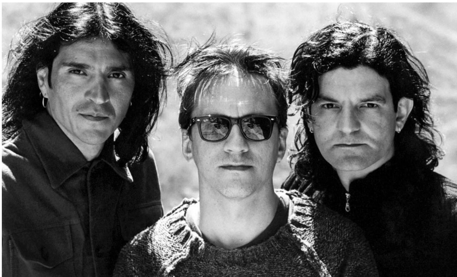
ENANITOS VERDES, FORMACIÓN AÑOS 90. Son pocos no ya los grupos de rock argentino, sino los artistas en español que tienen un tema tan popular.