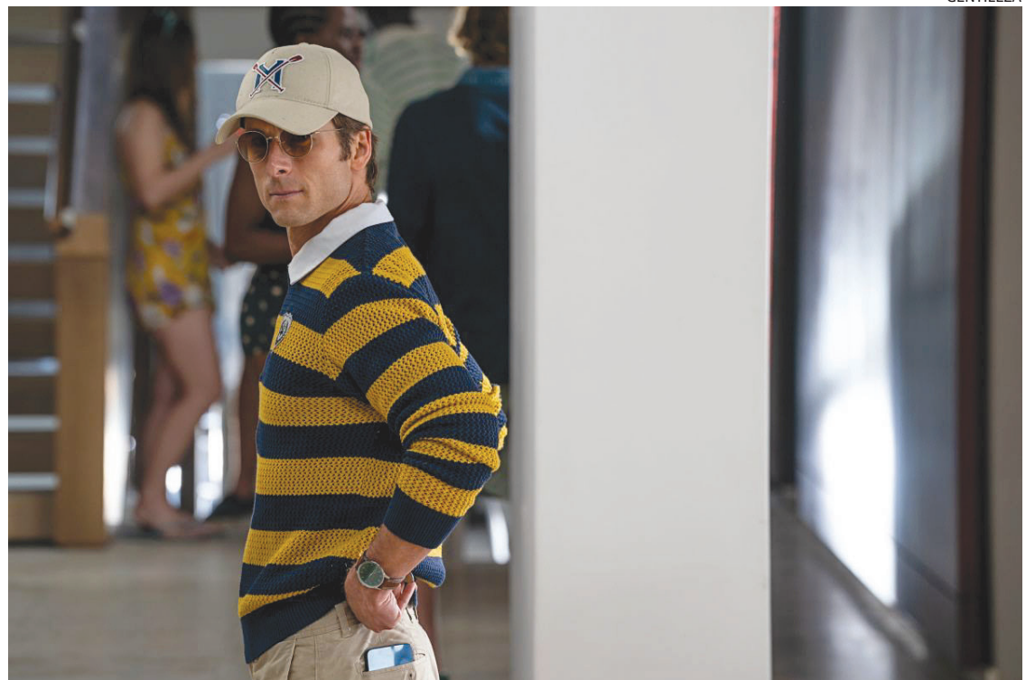
PROTAGONISTA. Glen Powell actúa y produce esta película, que cuenta con un gran elenco.

El guión se inspiró en la película británica "Ocho sentencias de muerte", de 1949, de Robert Hamer y John Dighton.