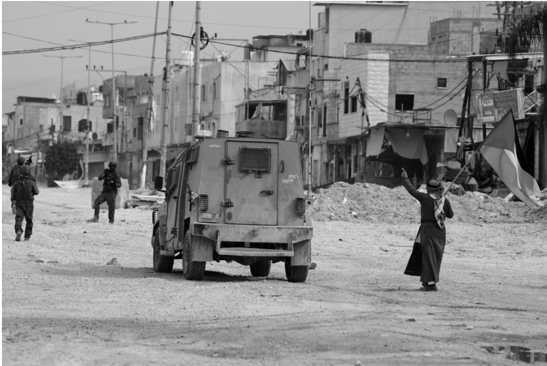
MEDIDA OFICIAL. El Estado israelí aprobó la reapertura del proceso de registro de tierras en Cisjordania.