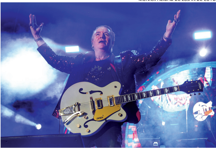
IDOLO. Los vecinos, turistas y fans de Miguel Mateos corearon sus clásicos.

guel Mateos realizó un recorrido por los grandes clásicos que marcaron a varias generaciones del rock nacional.