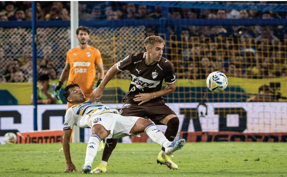
SIN IDENTIDAD. Boca volvió a mostar su peor versión y solo igualó con Platense 0-0 en La Bombonera.

Pareció haber un lavado de cerebros en el vestuario durante el entretiempo. Porque, sin cambiar nombres, Boca cambió la actitud. Como si se hubiera dado cuando que con su pasividad y falta de agresividad regaló un tiempo. Pero después de una ráfaga, Boca volvió a la