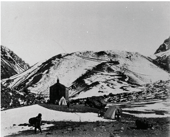
CASUCHA DEL REY. Antigua construcción en Paramillo de Las Cuevas. Izquierda, fotografía de Christiano Junior, AHM, de 1881. Derecha, fotografía de 2023, autora Cristina Prieto Olavarría.