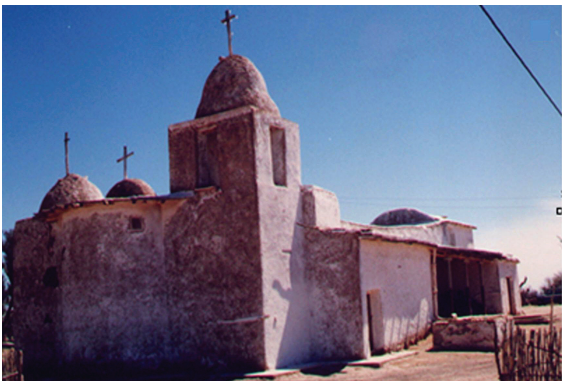
ZONA DE SECANO. Imágenes de la capilla Nuestra Señora del Rosario, en el norte de Lavalle. Fotografías tomadas en 1999 y 2021 por Horacio Chiavazza.

EVALUACIÓN. Entre 2023 y 2025 se realizaron investigaciones arqueológicas en sitios que tienen edificios patrimoniales expuestos al impacto del cambio climático. Esto condujo a implementar tecnologías geoespaciales para preservar digitalmente tres exponentes de la arquitectura histórica de Mendoza: Capilla del Rosario de Las Lagunas, Casucha de Paramillos y Ruinas de Paramillos, ambas de Las Cuevas.