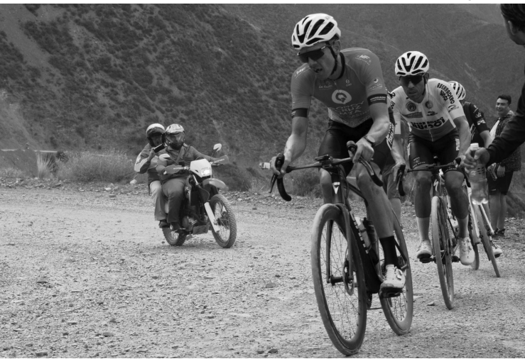
IMPACTANTE. Traico, ganó la tercera etapa en la Cruz del Paramillo.

Los kilómetros finales del parcial fueron emotivos y Trai-