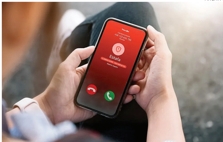
PELIGRO. Llamadas de origen desconocido pueden ser fraude.

También es clave prestar atención si solicitan datos sensibles. Ninguna entidad legítima pide contraseñas, códigos de verificación, números completos de tarjeta o claves ban-