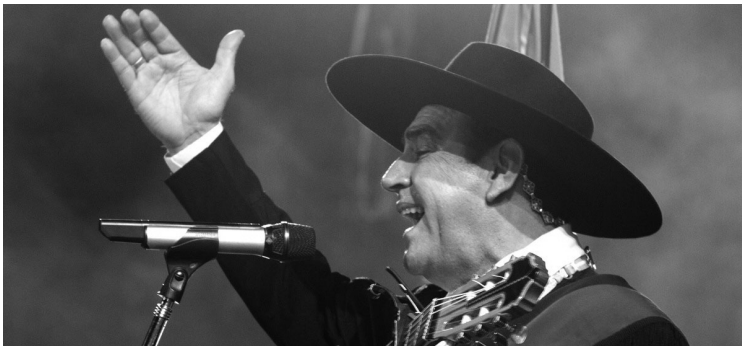
CHACHEÑO PALAVECINO. Dará un recital el lunes 9, sin fiesta previa.

pensadas exclusivamente para recitales. El lunes 9 subirán al escenario del teatro griego el Chaqueño Palavecino, La Re Pandilla y Euge Quevedo y LBC, en una noche atravesada por el folclore y el cuarteto. El martes 10 será el turno de Abel Pintos, Campedrinós, Maggie Cullen y Ángela Leiva, con una grilla que combina balada,