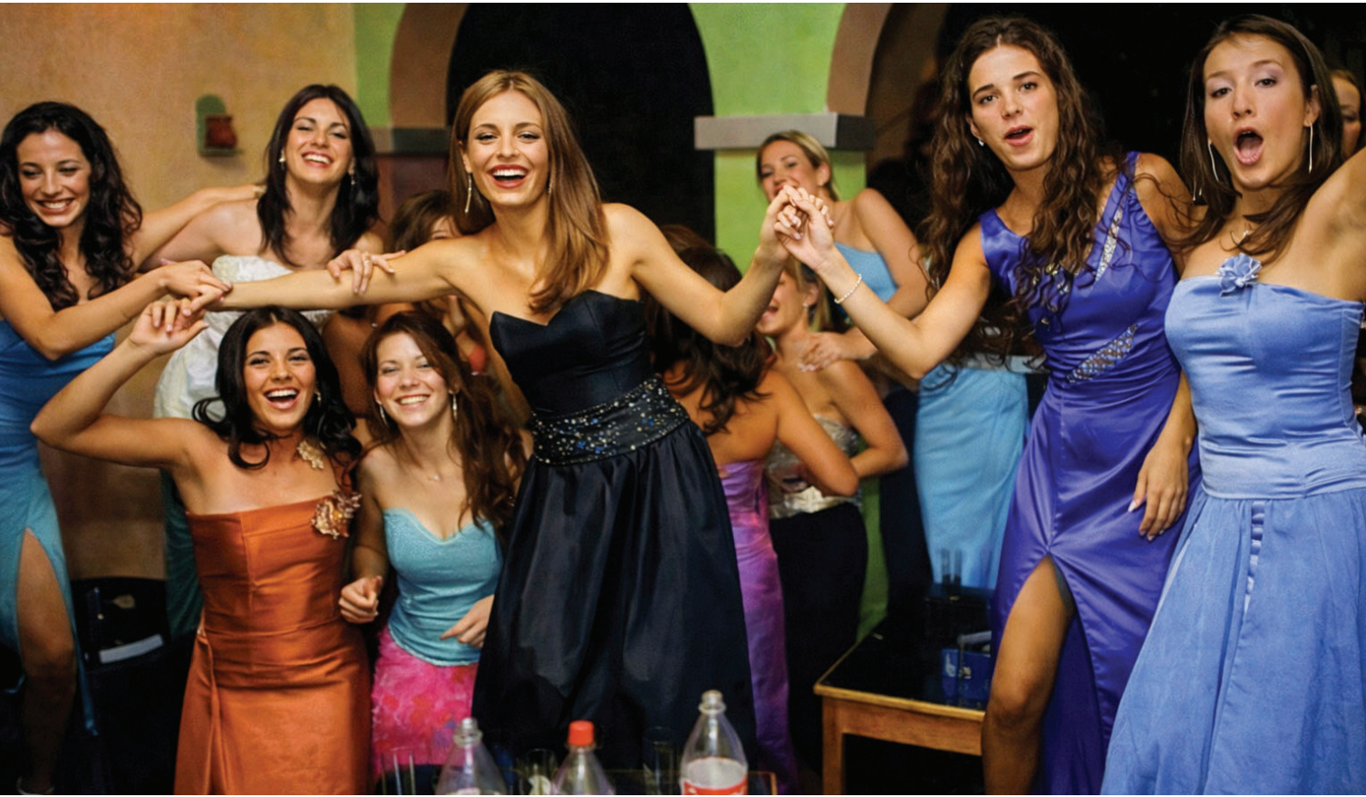
DESCONTRACTURADAS. La imagen de las candidatas en poses más informales ayudaron a la eliminación de la capa.

VENDIMIA 2003. En medio de discusiones por el recato de las chicas, durante ese año la Fiesta cambió la imagen de las soberanas en el contexto de una Mendoza que se llenó de turistas.