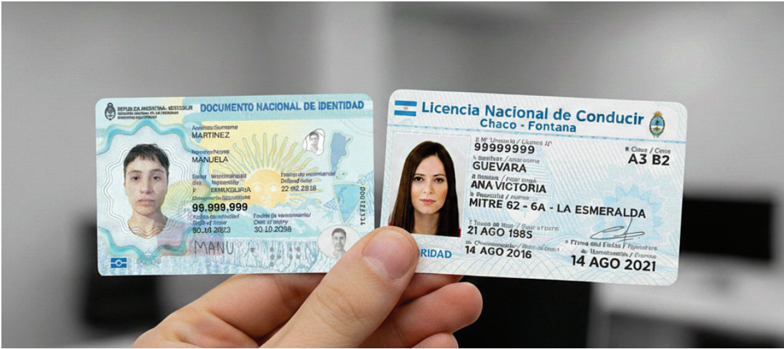
CLAVE. Hay plazos a tener en cuenta para evitar trámites innecesarios.

Este año deben renovarlo obligatoriamente quienes lo hayan emitido en 2011, ya que el DNI para mayores de 14 años dura 15. También existen actualizaciones obligatorias para menores: entre los 5 y 8 años, y nuevamente a los 14 años.