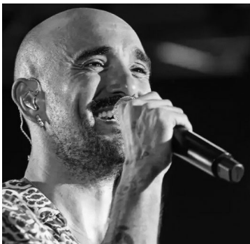
ABEL PINTOS. Canta el martes 10.