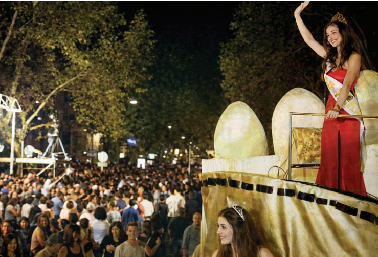
DESFILE. Ese año, la Vía Blanca fue verdaderamente multitudinaria.

que los vestidos rondaban menos de un kilo. La consigna era que el cuerpo pudiera moverse y sonreír sin pelear con la tela. En una fiesta donde cada paso se observa, la movilidad era parte del mensaje.