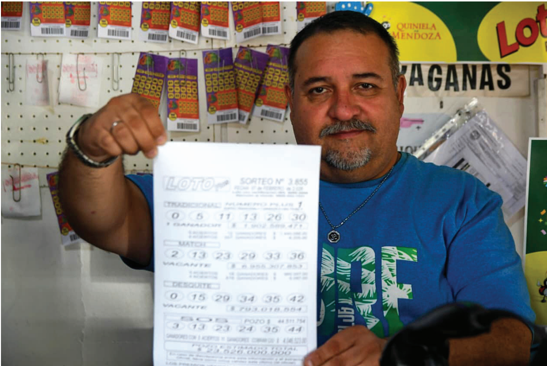
GANADOR. El agenciero muestra los números ganadores. El afortunado jubilado pidió preservar su identidad.

El ganador es un jubilado que cobra el haber mínimo y que, según confiaron desde la agencia, juega desde hace más de 30 años en el mismo lugar. Obvia-