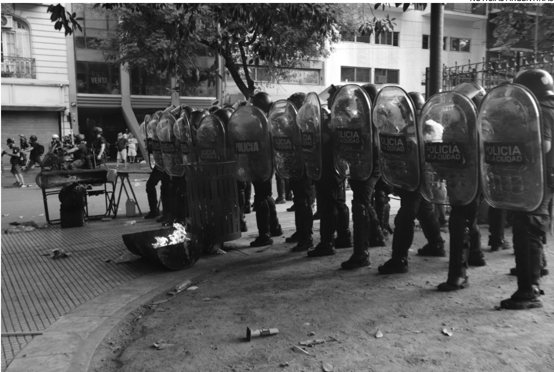
CHOQUE. Policías de la Ciudad de Buenos Aires avanzan contra manifestantes, que les arrojan objetos.