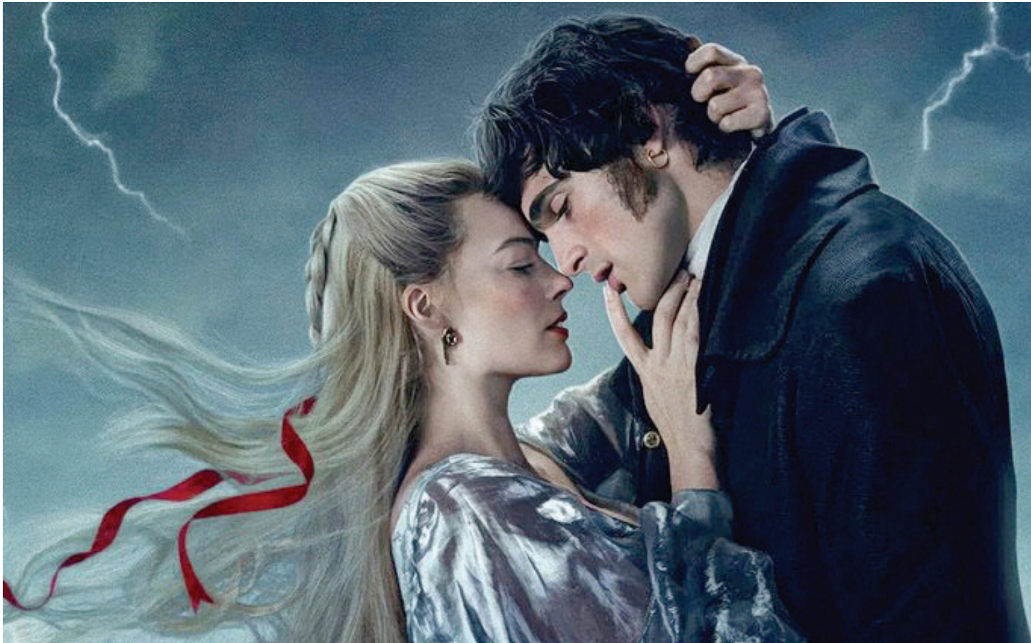
DUPLA PROTAGÓNICA. Una de las atracciones de esta adaptación de "Cumbres borrascosas" es la presencia de Margot Robbie y de Jacob Elordi.