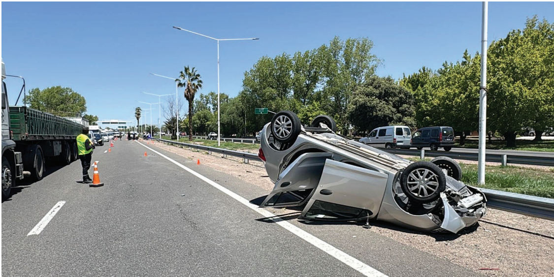
VUELCO. Un Renault Sandero quedó con sus ruedas hacia arriba en el carril rápido del Acceso Sur, mano al Norte.