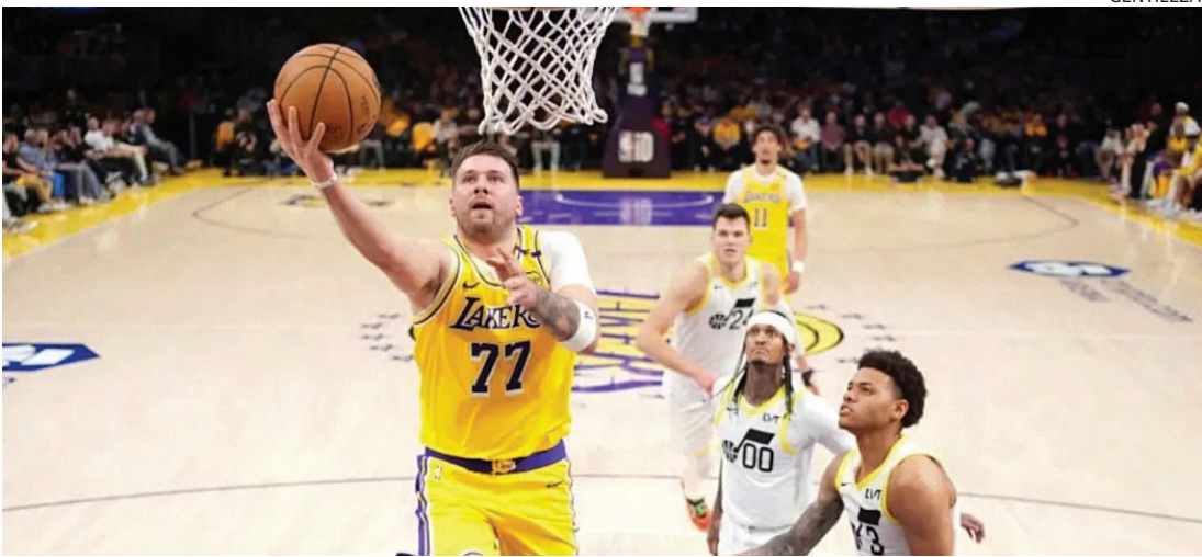
CRACK. Luka Doncic, figura de Los Ángeles Lakers y de la NBA.