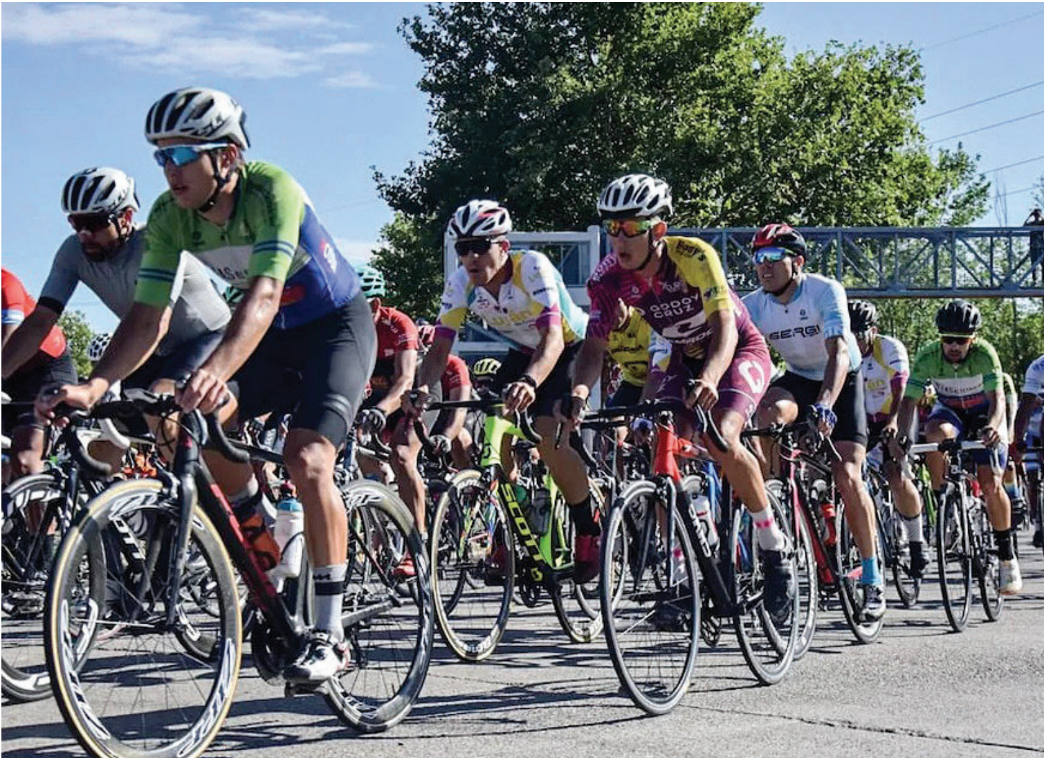
HISTÓRICO. Desde el parque San Vicente, en Godoy Cruz, arranca la edición número 50 de giro mendocino.

CICLISMO. La “más argentina de las vueltas” comienza su periplo este jueves y se extenderá durante 11 días con los mejores pedales de la región. Conocé todas las etapas y el historial de campeones.