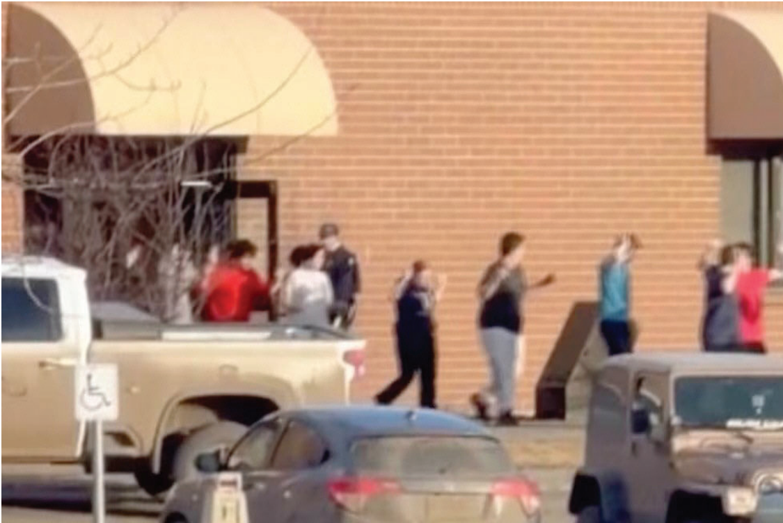
EVACUADOS. La captura de video muestra a estudiantes saliendo de la escuela Tumbler Ridge tras el tiroteo.

ATAQUE VIOLENTO. Una comunidad de 2.400 habitantes fue protagonista de la escena más dramática vivida en colegios canadienses.