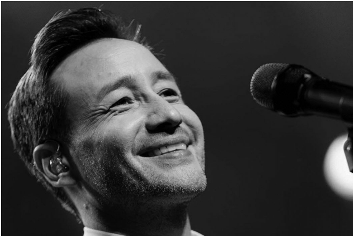
LUCIANO PEREYRA. El exitoso cantante tendrá a su cargo el show luego de la repetición del Acto Central.

GRILLA. Pereyra será el encargado de actuar en la repetición del espectáculo, el domingo. El lunes y el martes, ya sin fiesta, estarán respectivamente Palavecino y Pintos. Hoy salen a la venta las entradas.