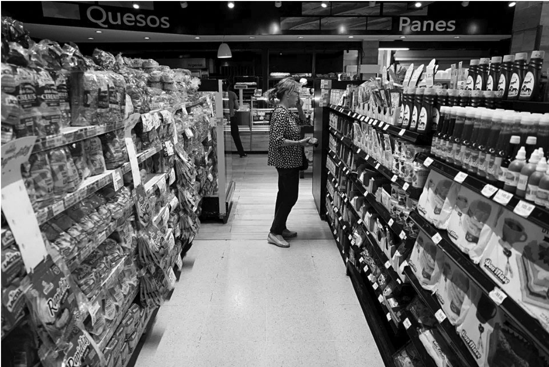
PRECIOS. En el primer mes de 2026, el promedio de los alimentos subió por encima de los valores esperados.

La otra categoría que varió por encima del nivel general (32,4%) en el último año fue Educación, con 35,9%. Las restantes, en tanto, lo hicieron por debajo: Otros bienes y servicios (31,9%); Atención médica y gastos para la salud (28,4%); Esparcimiento (25,3%); Equipamiento y mantenimiento del hogar (21,5%); e Indumentaria (14,3%).