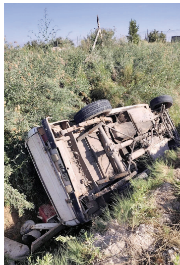
HERIDOS. Cuatro ocupantes de la camioneta sufrieron lesiones.

cio de Emergencias Coordinado asistieron a la conductora, quien fue diagnosticada con politraumatismos moderados. Al igual que en el primer siniestro, la mujer dio negativo en el control de alcoholemia realizado por el personal policial.