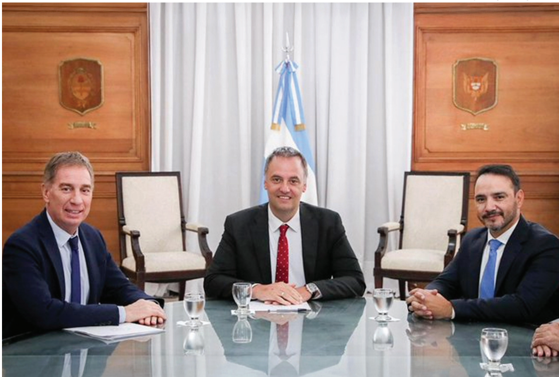
LA ROSCA. El ministro Diego Santilli volvió a reunirse con el gobernador de Corrientes, Juan Pablo Valdés.

En Balcarce 50 aseguran que esa película no se reeditará. Integrantes del gabinete y de la mesa política apuestan a que el