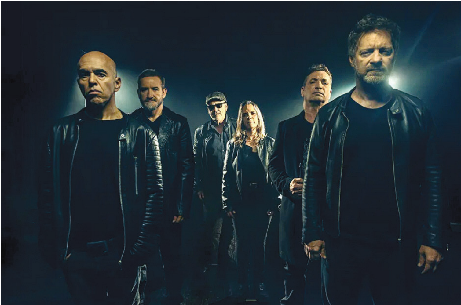
LEYENDAS DEL ROCK NACIONAL. La banda Las Pelotas es una de las más populares del país y será la invitada para la fiesta de este año.

VENDIMIA. La edición 2026 suma peso artístico y emocional a una celebración que ya forma parte del ADN vendimial, siempre junto a la Orquesta Filarmónica de Mendoza en los viñedos del Aeropuerto.