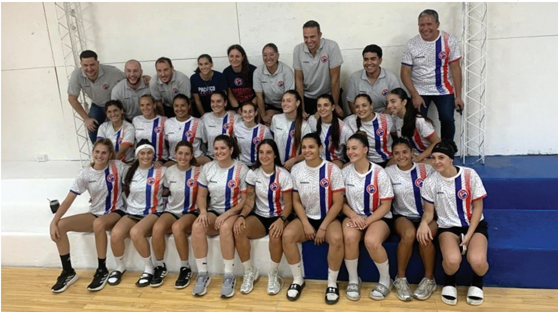
PACÍFICO VOLEY. El Team de la "S" que competirán en la Liga Nacional en las próximas semanas.