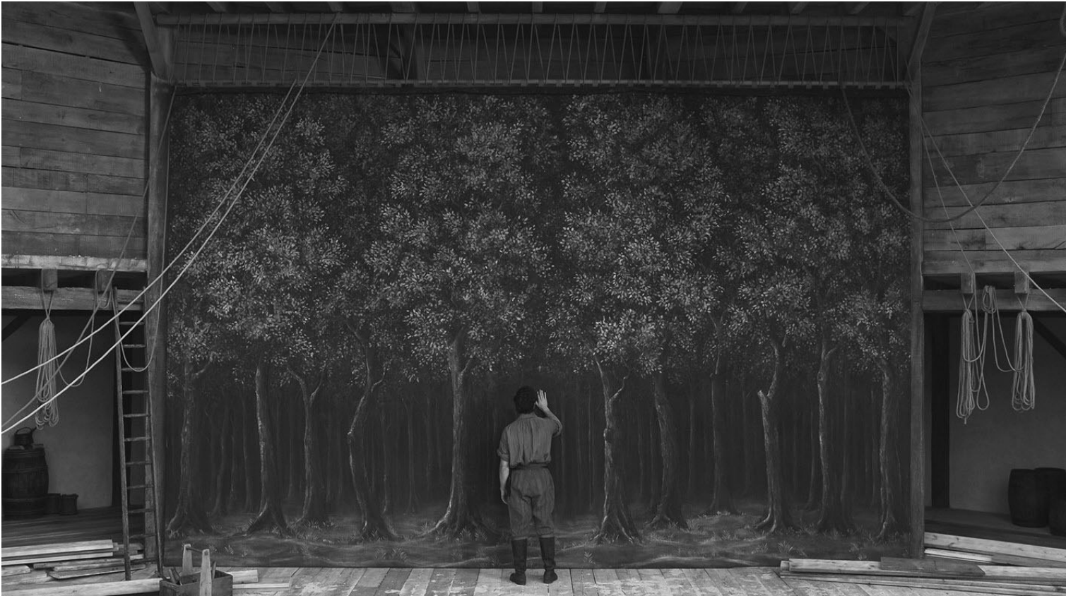
ESCENA. Una de las fortalezas de la película "Hamnet", además de la historia que propone con Shakespeare de por medio, es el cuidado visual.

Zhao filma el dolor sin ornamentos victorianos ni subrayados solemnes. Jessie Buckley