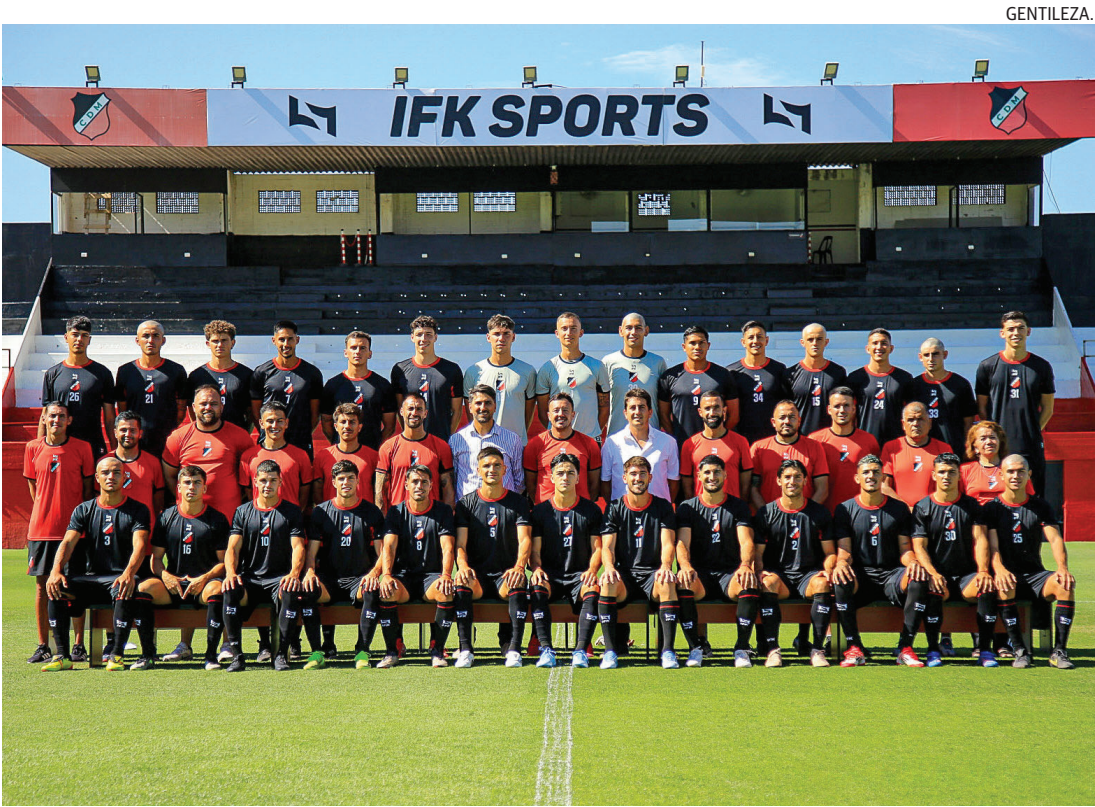
ESTRENO ABSOLUTO. Deportivo Maipú jugará su primer partido oficial de la temporada 2026.