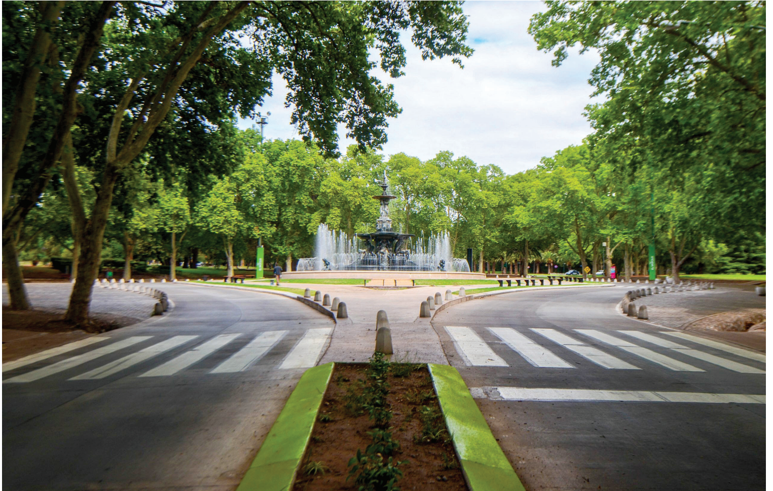
BIEN MENDOCINO. El Gobierno busca sumar servicios de calidad, ampliar las propuestas para visitantes y ordenar usos del Parque.

Enumeró obras en ejecución, como la ruta provincial 99 y licitaciones vinculadas a sitios históricos, y señaló que existen