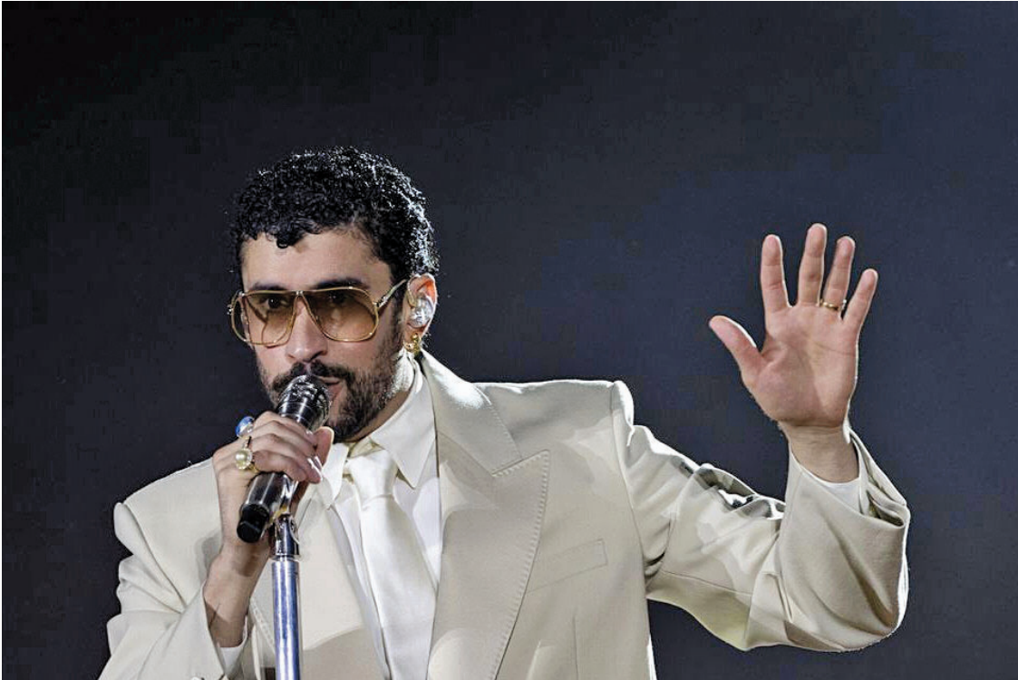
ESPECTÁCULO ÚNICO. Bad Bunny protagonizará el show del medio tiempo.

Se enfrentarán New England Patriots y Seattle Seahawks, en una reedición del histórico cruce que protagonizaron en el Super Bowl 49. Los Patriots llegan tras consagrarse campeones de la AFC y buscarán su séptimo título, lo