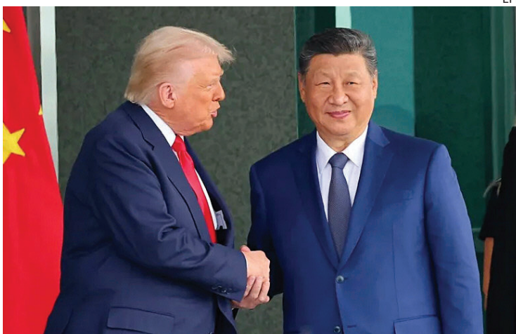
ENCUENTRO. Donald Trump y Xi Jinping se reunieron en Corea del Sur.

Por su parte, Trump y Xi habían hablado por última vez el 25 de