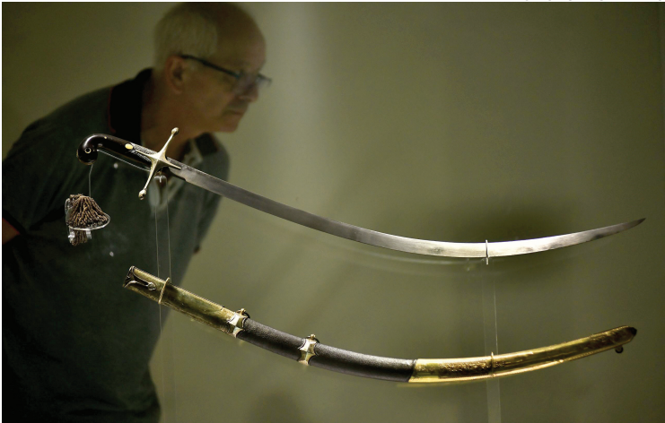
RELIQUIA. El sable con el que combatió el general San Martín.

Desde el entorno del mandatario adelantaron que el acto tendrá un marcado protagonismo presidencial. “Es una movida de Nación”, señalaron, en referencia a la organización y al perfil que se busca im-