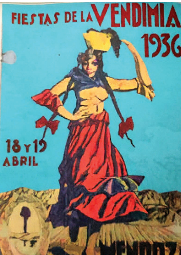
AFICHE. Así se promocionó la “fiesta madre” de la Vendimia.

Como dice el dicho, “pasó mucha agua bajo el puente” para que la Fiesta de la Vendimia sea lo que es hoy: un espectáculo único de música, sonido, coreografía y luces mágicas que envuelven al teatro griego Frank Romero Day. Para contar cuál fue el origen de esta