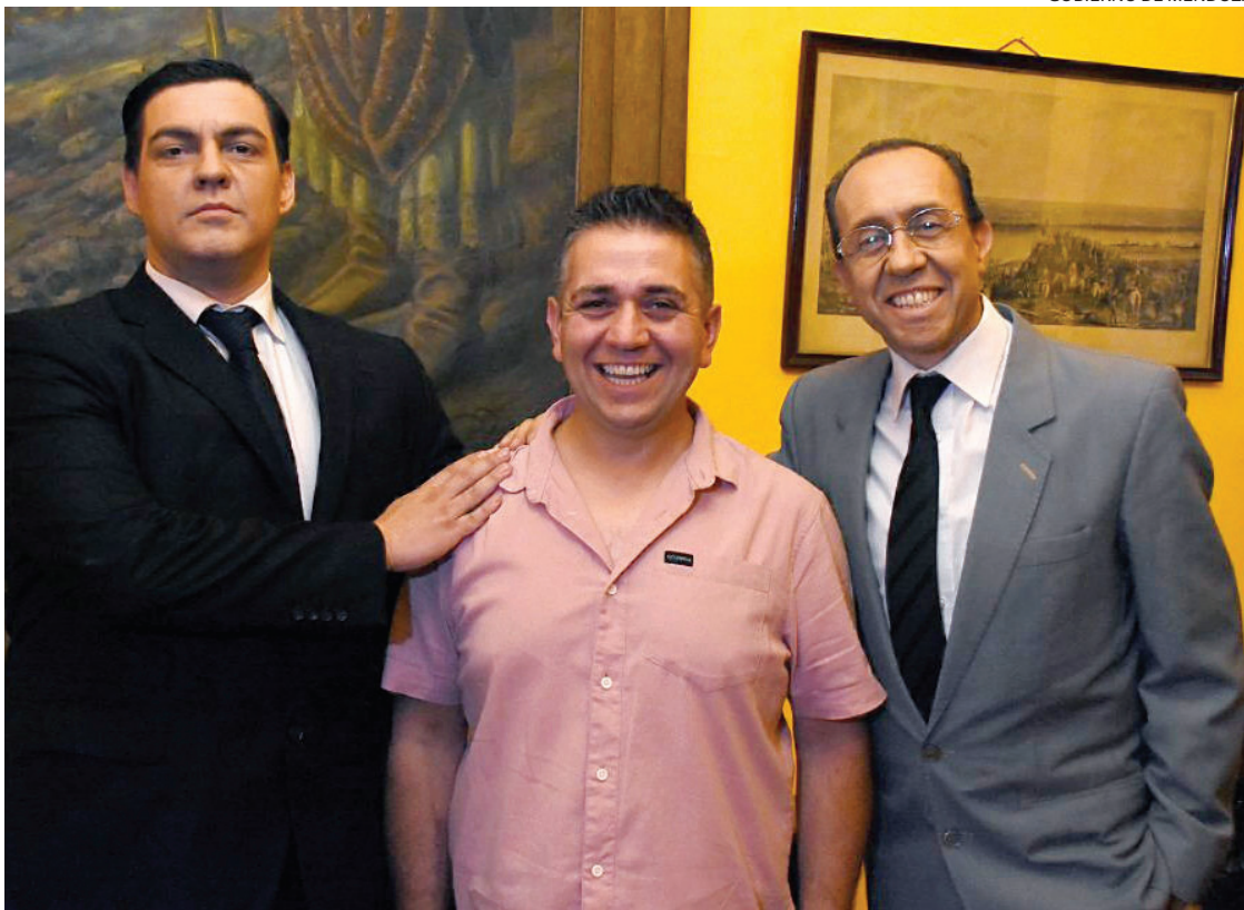
EMBLEMAS. Dos actores encarnarán a Cano y Romero Day, quienes crearon el festejo mendocino de la Vendimia.

Guillermo Cano fue gobernador de Mendoza entre 1935 y 1938 y fue una figura clave en la institucionalización de la Fiesta Nacional en 1936. Lo propio hizo su ministro de Industrias, Obras Públicas y Riego, Frank Romero Day, y juntos adoptaron y adaptaron la tradición europea para celebrar la cosecha de la uva y la establecieron como un evento oficial, anual y emblemático para la provincia.