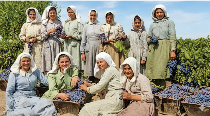
REINAS. Las aspirantes al primer trono vendimial (foto mejorada con IA).