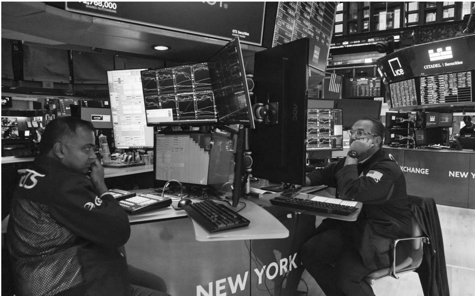
MERCADOS. Los bonos argentinos habían comenzado la rueda ensayando una mejora, pero los inversores a la venta.