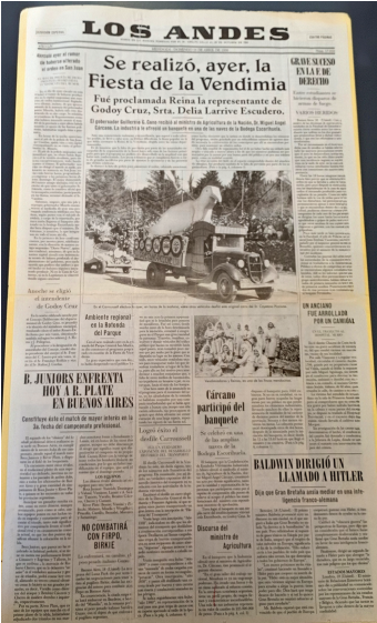
PÁGINA. La publicación original de nuestro diario.

En 1913 se realizó la primera propuesta de una fiesta vendimial. Recién 23 años más tarde fue posible su celebración.