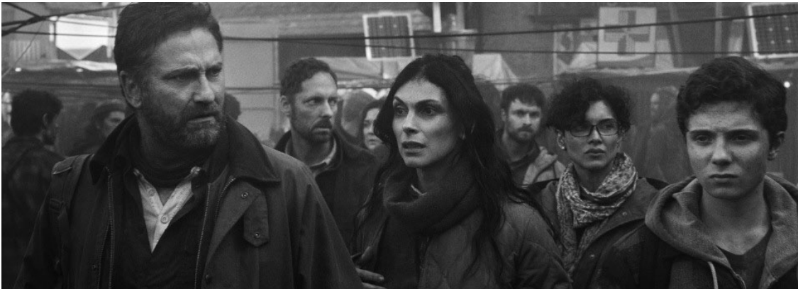
EL DÍA DEL FIN DEL MUNDO: MIGRACIÓN. Nueva entrega de la saga, con Gerard Butler en el protagónico.