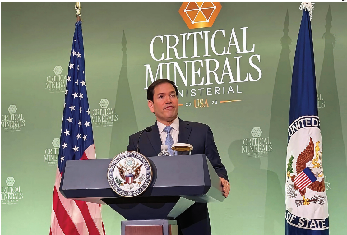
RUEDA DE PRENSA. Rubio dijo que Estados Unidos mantenía conversaciones sobre países “dispuestos a aceptar”.

Rubio señaló ayer: “Tenemos conversaciones sobre países dispuestos a aceptar nacionales de